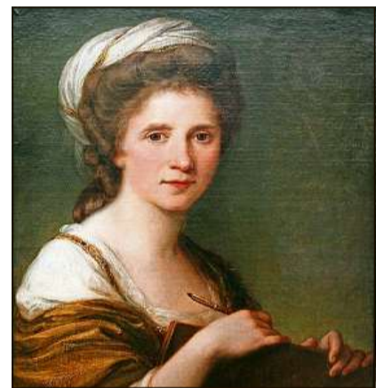
Autopurtret dad Angelika Kauffmann (1784).

Il 1881 è Segantini sa rendi cun Bice Bugatti en la Brianza, ina regiun rurala al nord da Milaun. El ha mategià en tuns stgirs la vita simpla dals purs e pasturs; a Pusiano (provinza da Com) è naschida l'emprima versiun dal maletg «Ave Maria en la traversada» (1882). Il 1886 è sa domicilià Segantini, ch'aveva ina tenuta anticlericala, cun sia famiglia a Suagnign. Vittore Grubicy ha fatg el enconuscent en lungas discussiuns durant l'enviern 1886–87 cun las pli novas tendenzas artisticas en Frantscha. Segantini ha purtetà ina segunda versiun da l'«Ave Maria en la traversada», quella giada en la tecnica dal divisiunissim. En las muntognas cun lur glisch clera ha l'artist chattà ina nova lingua figurativa: el ha conferi a las cuntradas alpinas, observadas dad el cun acribia, ina glischur extraordinaria ed in cuntegn simbolic. Perquai valeva el – sper Ferdinand