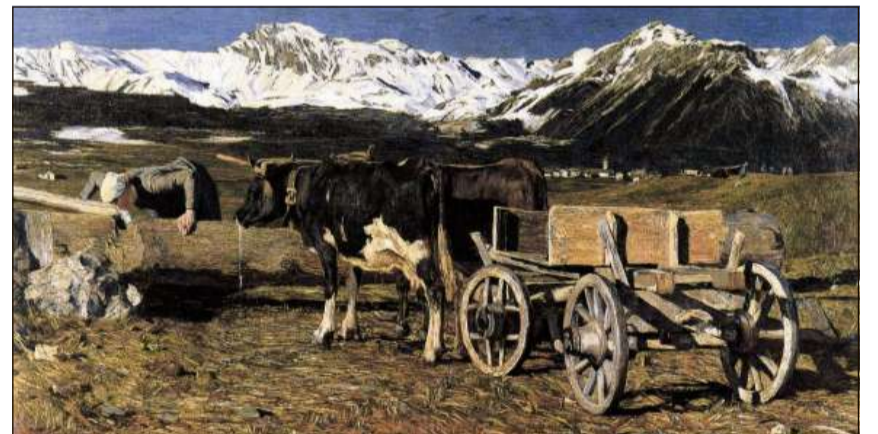
Maletg da Segantini da ses temp a Savognin (1888).