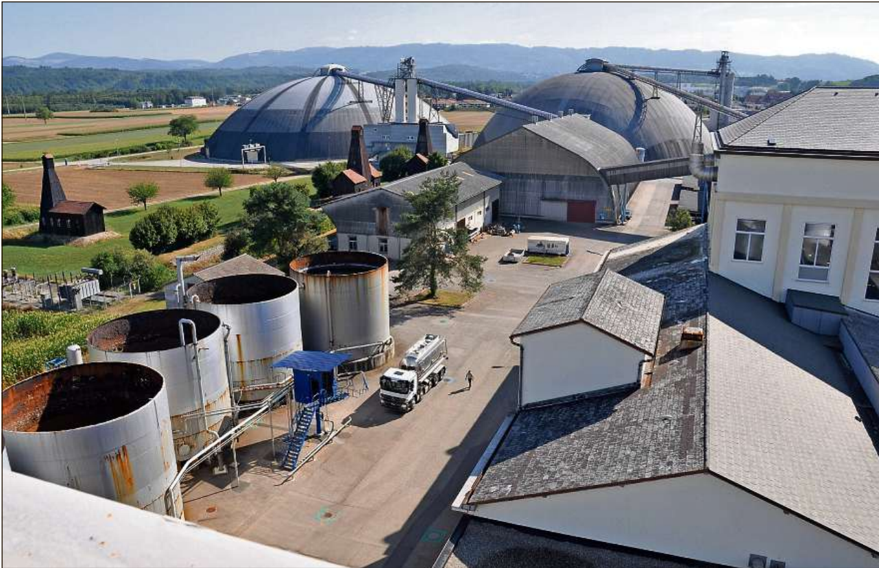
Snuizi sin il tetg da la salina da Riburg – malgrà la bella vista – pertge il bajetg ballucca in zichel pervi dal turnigl da la sola en la tarmenta chaldera.