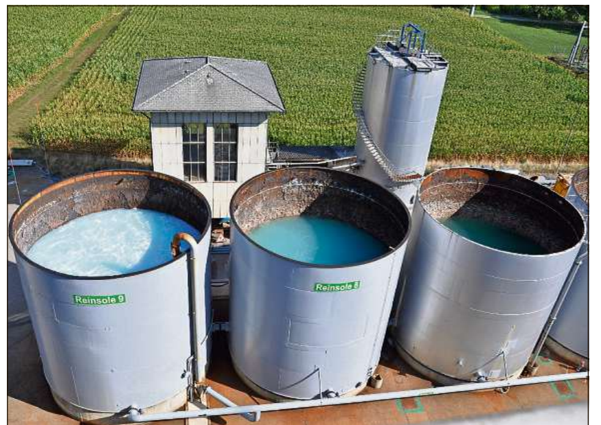
Da surengiu vesan els or in zichel sco cups da jogurt: Ils tancs gigantes en ils quals ins zaivra la chaltschina ord l'aua da sal.