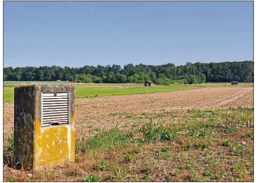
Mo il foss da ventilaziun tradescha ch'ins explotescha sal sut quests champs.