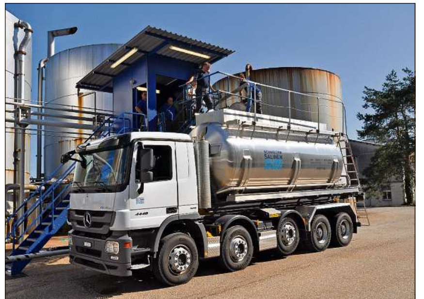
Il tanc dal camiun cuntegn restanzas da la produziun da sal. Quellas vegnan derschidas enavos en il terren.