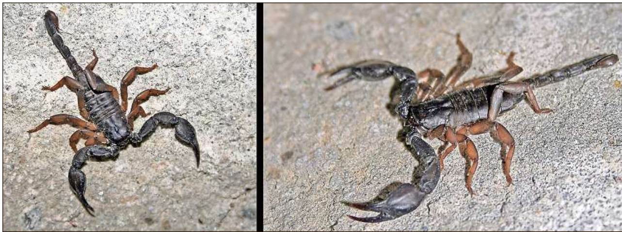
Euscorpium alpha – ina da las spezias derasadas en la Svizra dal Sid ed en l'Italia dal Nord.

Gist sur ils pes dals scorpiuns sa chatta in organ sensitiv che sumeglia ina pitschna sfessa. Quest organ reagescha sin squassadas. El registrescha las vibraziuns d'in bau che chamina in mez meter davent dad el. Scorpiuns han fin sis pèra eglis. Ils dus eglis principals èn amez il