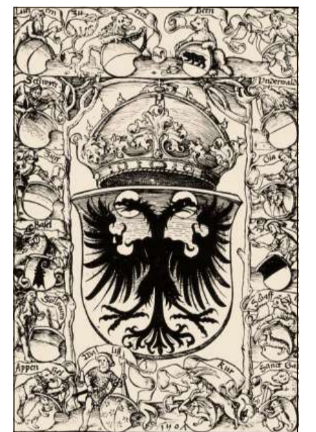
La Veglia Confederaziun sco part dal Sontg Imperi roman.

Igl è grev da definir in'«identità» durant il temp medieval, ma i para che la lingua na saja betg stada quella giada il factur decisiv. En general na correspundan ils cunfins politics ed ecclesiastics betg a la re-