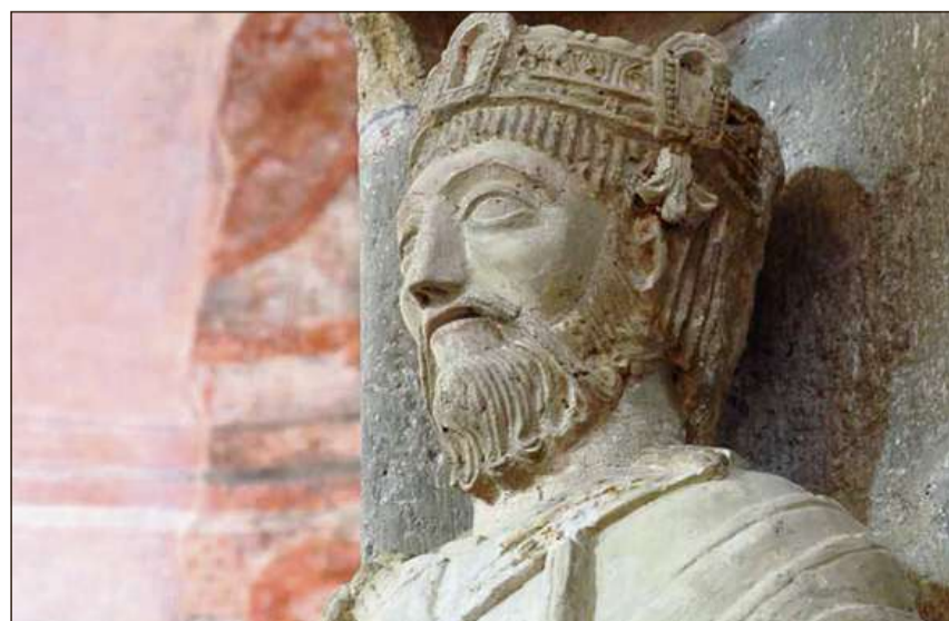
Statua da Carl il Grond en la claustura da Münstair.

partiziun linguistica. La classe clericala dispoia anc dal latin, duvrà er da la glieud pli instruida en fin il 18avel tschientaner. Durant il 17avel e 18avel tschientaner è il franzos en l'entira Europa la lingua da la cultura dominante – sumegliantamain a l'anglo-american da noss dis sin il champ economic e finzial e sin quel tecnic e scientific. Ma sin il nivel popular èsi cler ch'il fatg da discurre la medema lingua è adina stà favuraivel per ils contacts e barats tranter vischins.