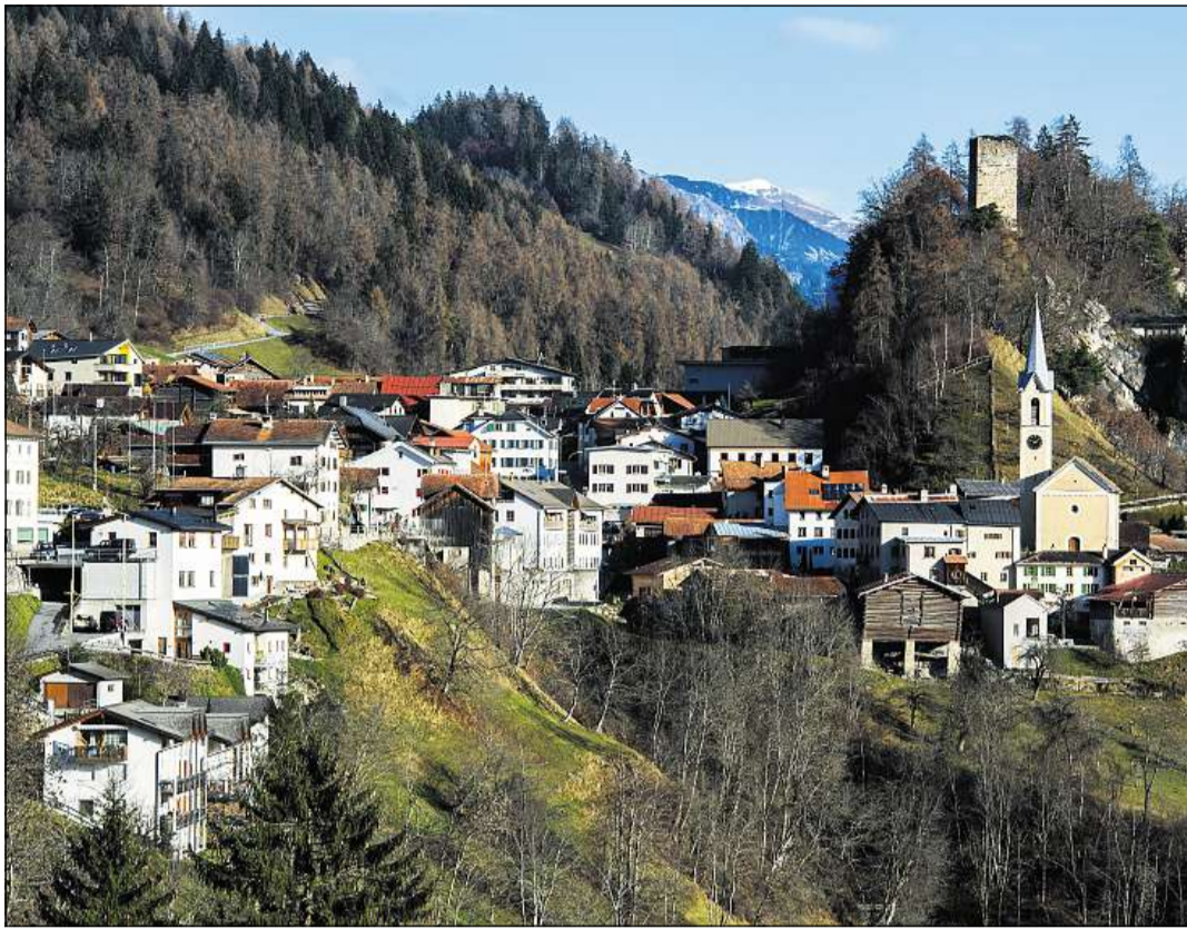
Trin Vitg cun la fortezza da Canaschal.