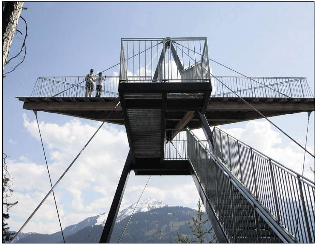
A Conn (al cunfin ost da Flem) avra la tur panoramica «Il spir» la vista sur la Ruinaulta.