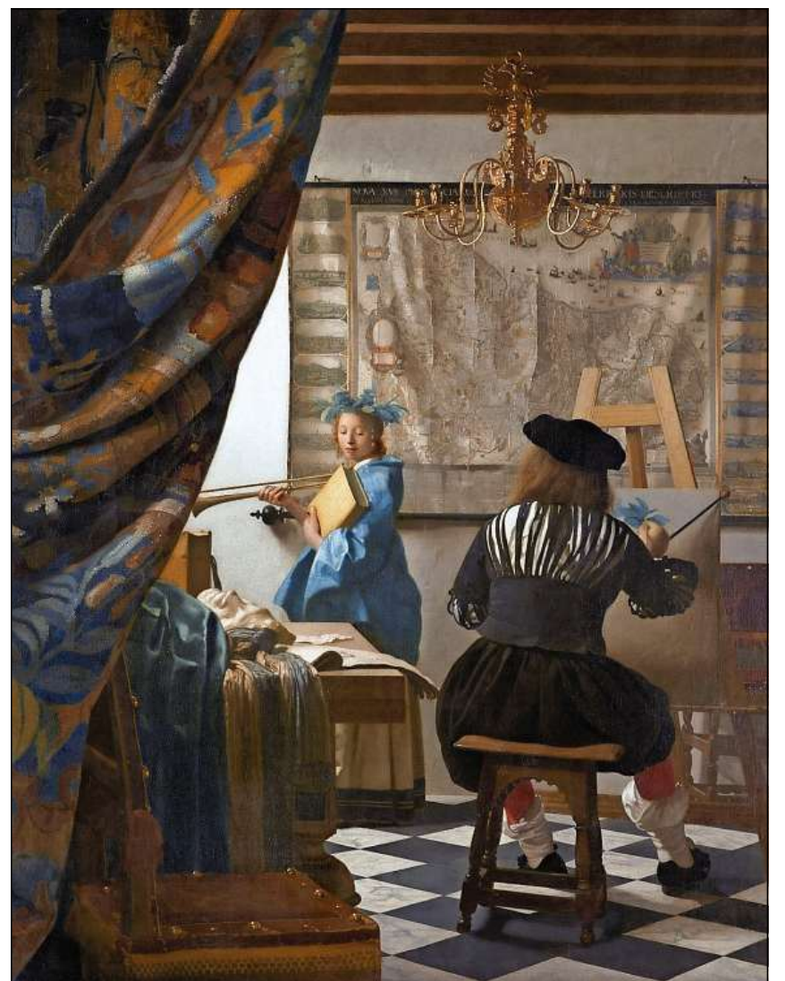
Jan Vermeer, Allegoria da la pictura (ca. 1670).

Pli baud u pli tard han ovras d'art damai basegn d'ina tgira premurusa u d'ina ope-