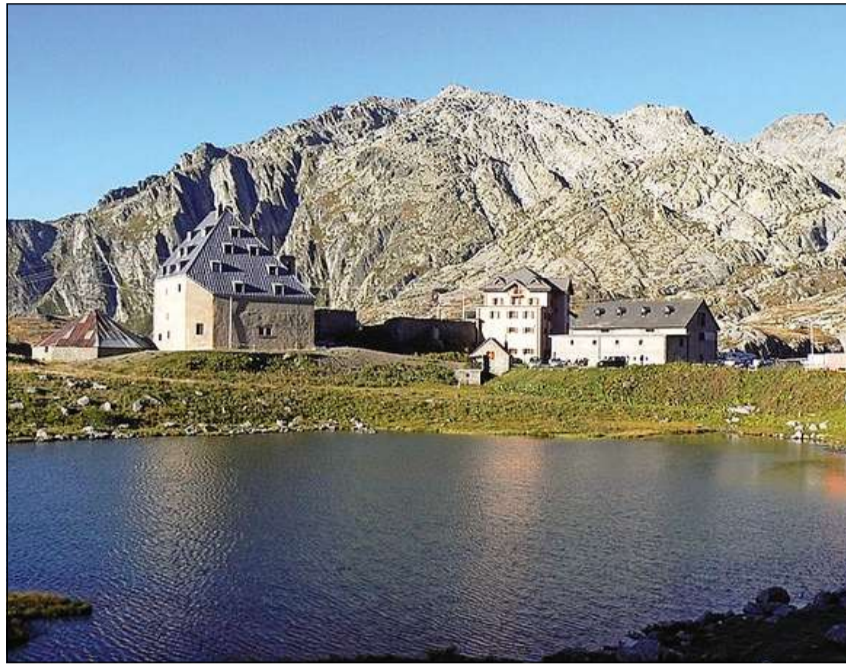
Sin il Pass dal Gottard.

La baselgia han ins laschà per il mument sco ch'ella era. Al sacerdot èsi vegni scumandà da dar da mangiar e da baiver ed albiert per daners per evitar la rinfatscha ch'el «fetschia l'ustier». Ilis quatter spirituals (tranter il 1629 ed il 1636) n'han però betg supportà ditg las cundiziuns displaschavlas d'abitar; las chombras eran stretgias e las paraisds pauc isoladas cunter la fradaglia. Suenter la mort dal