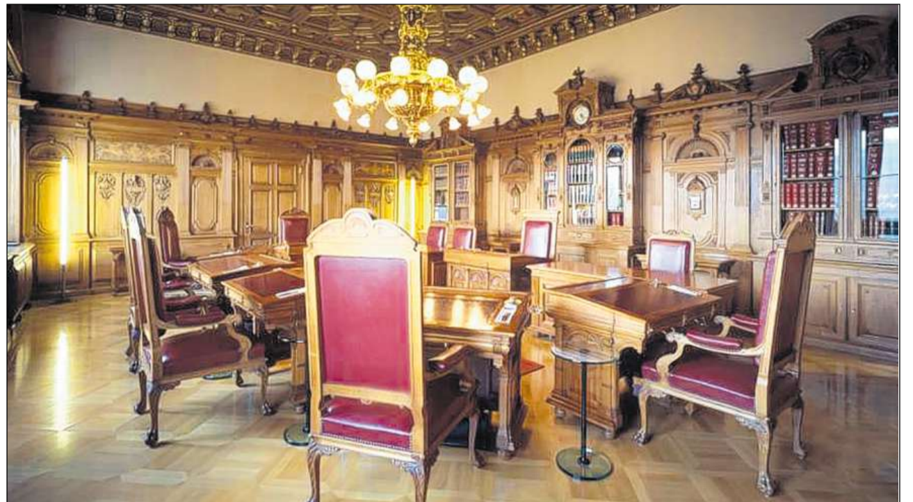
Sguard en la stanza da sedutas dal Cussegl federal.

Ils detagls da las discussiuns e da las decisiuns dal Cussegl federal n'èn betg publics. La gronda part da las decisiuns vegn prendida en encliegentscha (senza votaziun). Vegni votà davart ina fatschenta, decida la maiorità. La decisiun sto vegnir surpigliada independentamain da l'opinuin persunala da tut ils commembas dal Cussegl federal: quai numnan ins il princip