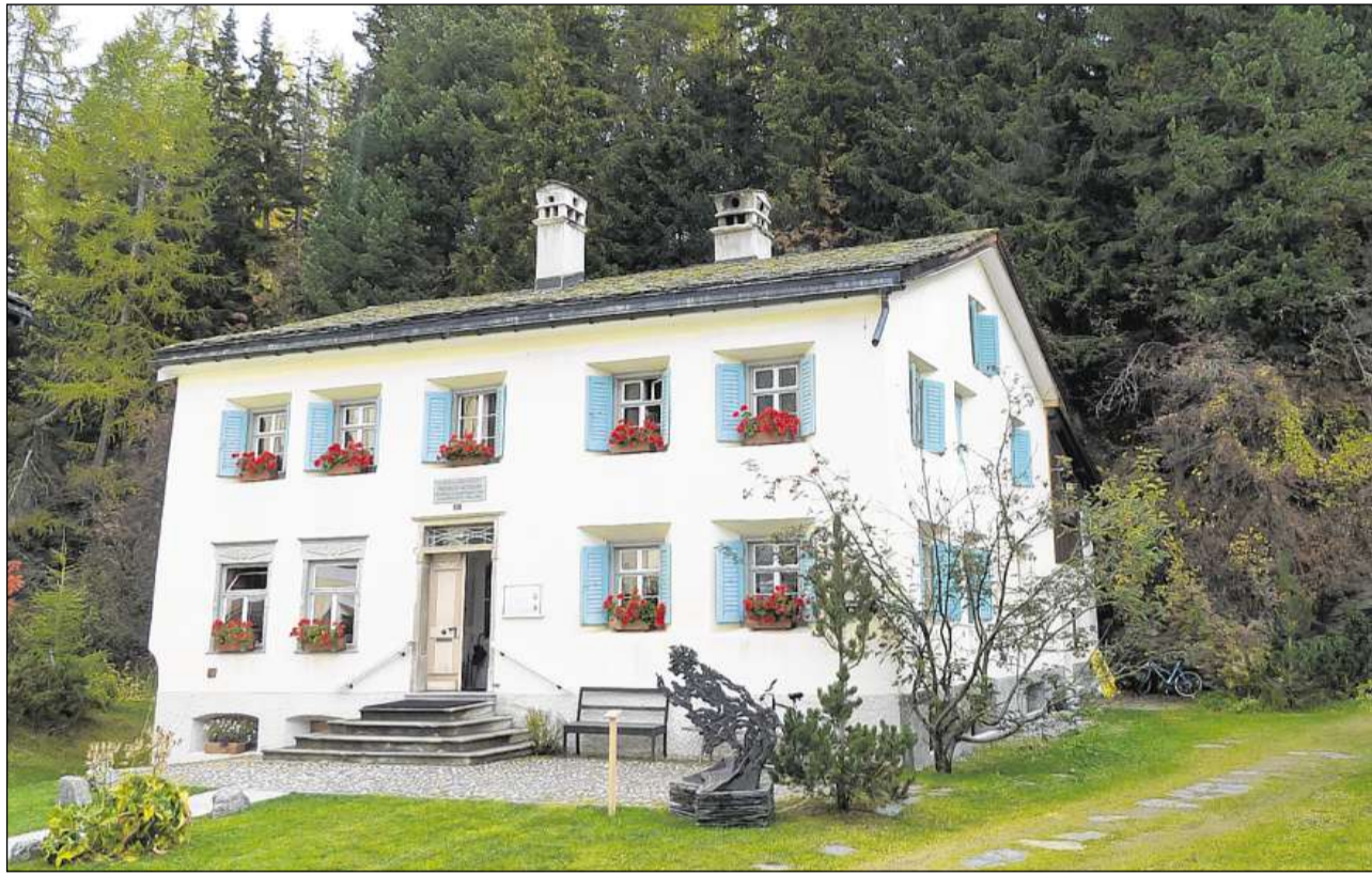
Chasa Nietzsche a Segl-Maria.

■ Il filosof tudestg Friedrich Nietzsche (1844–1900) è stà il pensader ch'ha formulà ils problems e las sfidas da la moderna a moda uschè clervesenta e precisa sco strusch insatgi avant el. Sias scrittiras vegnan edidas fin oz en grond dumber e legidas ed interpretadas tant d'in public laic sco er da filosofs dal fatg. Tar sias ovras las pli impurtantas tutgan «Unzeitgemässe Betrachtungen» (1873–76), «Menschliches, Allzumenschliches» (1878–80), «Die fröhliche Wissenschaft» (1882), «Also sprach Zarathustra» (1883–85), «Jenseits von Gut und Böse» (1886), «Zur Genealogie der Moral» (1887), «Der Antichrist» (1888) ed «Ecce Homo» (1889). La vita da Friedrich Nietzsche sa lascha divider bunamain matematicamain en las suandantas fasas: uffanza e furmazium (25 onns), professura a Basilea (10 onns), onns da viadi e produziun litterara (10 onns), stgiram dal spiert (10 onns). En ses onns da viadi e da la pli gronda produziun litterara (1879–1889) crodan er ils segiurns en l'Engiadina.