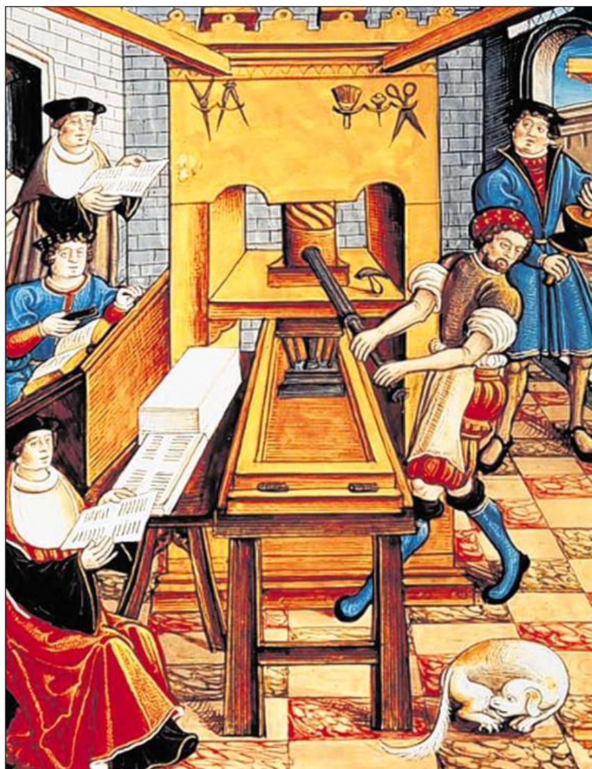
Il sistem da stampar cun letras moviblas ha revoluziunà la produziun da cudeschs. (Illustraziun dal 16avel tschientaner).

Il LIR cumpiglia bundant 3100 artitgels (geografics, tematics, artitgels da familias e biografias) davart l'istorgia grischuna/retica e la Rumantschia. Editura: Fundaziun Lexicon Istoric Svizzer; versiun online: www.e-lir.ch; versiun stampada: www.casanova.ch u en mintga libreria.