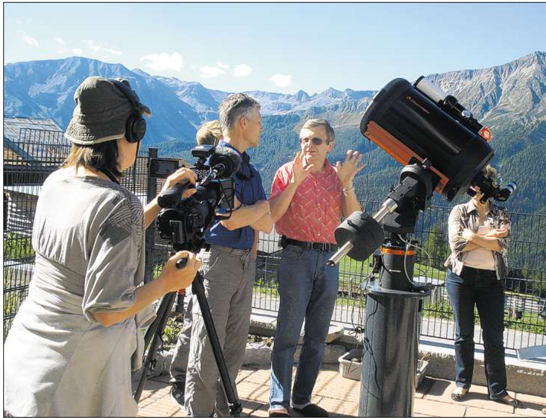
Participantas e participants tar ils curs da Lü-Stailas.

Program e gestiun dal center vegnan organisads e garantids da nus dus. Las principalas gruppas en mira dal center èn laics che s'interessan per il tschiel ed astronomes amateurs che vulan meglierar lur tecnica e far il pass da l'observaziun da las stailas a l'astrofotografia. Ina gruppa pli pitschna èn astronomes professiunals. Numerus èn ils interessents che vu-