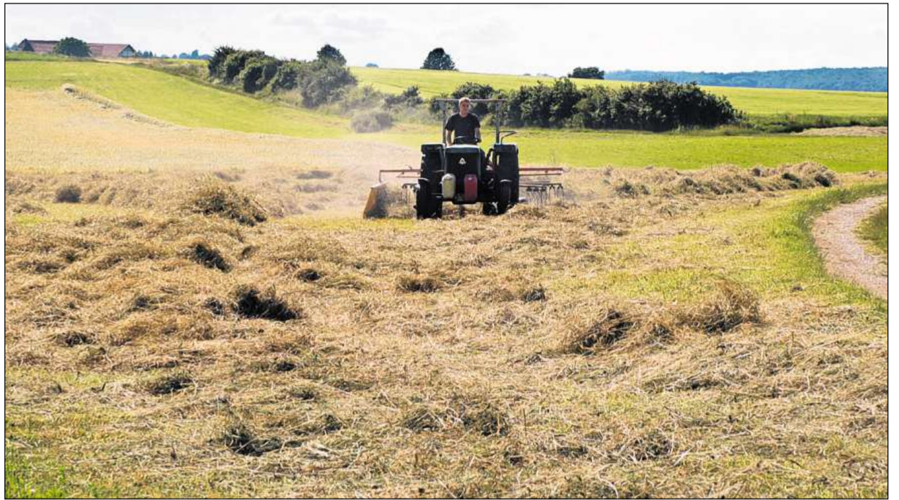
L'agricultura ha furnà sur lung temp il sectur da produzzion principal.

Las industrias svizras occupan damain lavurers dapi intgins decennis, surtut en ils secturs da textilias e da maschinas. In exempel: En ils onns 1960 era l'interpresa Paillard enconuschnenta en tut il mund per sias maschinas da scriver Hermès e sias ca-