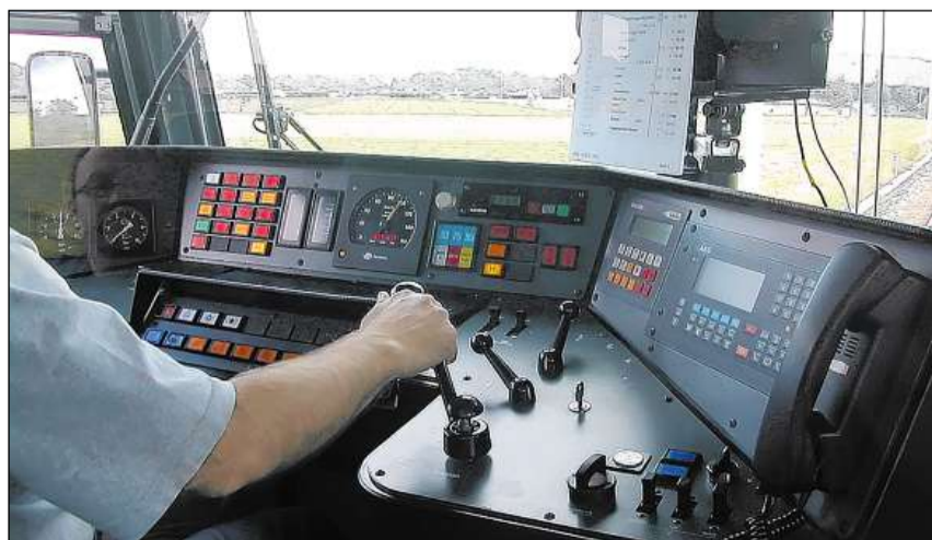
Il traffic public – in dals servetschs tradiziunals entaifer il sectur terziar.

Radund dus terzs da tut las interpresas industrialas en Svizra han main che 50 employads. Quels manaschis occupan ensemen però be circa 18% da tut las forzas da lavur. Las radund 200 interpresas grondas da la Svizra occupeschan percenter passa