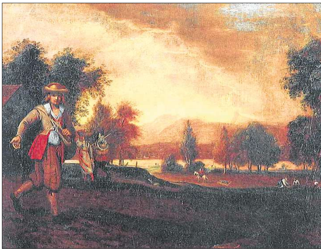
Agricultura en la Svizra Bassa (1670).

En il 18avel tschientaner gudagnava per exempel in quart da la populaziun dal chantun da Turitg il paun da mintgadi cun elavurar la mangola. Geneva è daventà il grond center d'uras da l'Europa; l'entira regiun dal Giura era dependenta da la citad. En la Svizra Orientala è la fabricaziun da tailas da glin indigen e da mangola importada sa sviluppada ad ina da las industrias las pli impurtantas. Basilea è daventà il center da la tessaria da bindels da saida ed è restà quai fin en il 20avel tschientaner.