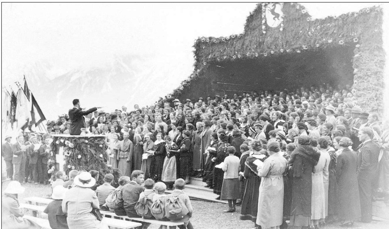
Festa da chant a Ftan il 1935.