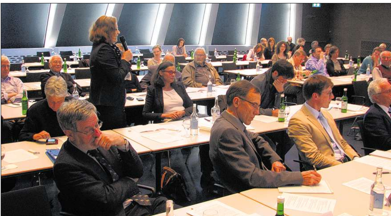
Intgins dals preschents en sala han prendi l'ocasiun per far dumondas.