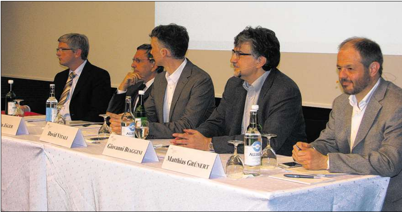
Ilis emprims perits sa preparan per tegnair lur referats.