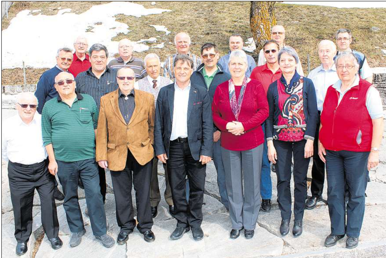
Quellas dunnas e quels umens en vegnids undrads a Vicosoprano sco veteranas e veterans federals.