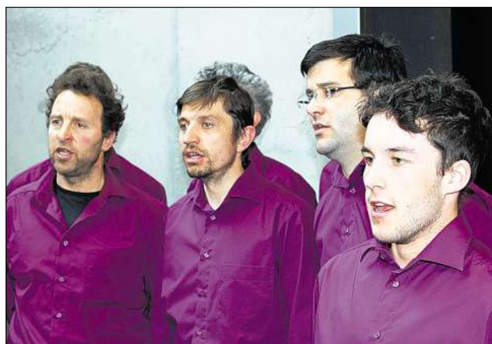
Ils umens dal Coro virile Bergaglia han embelli la radunanza a Vicosoprano.