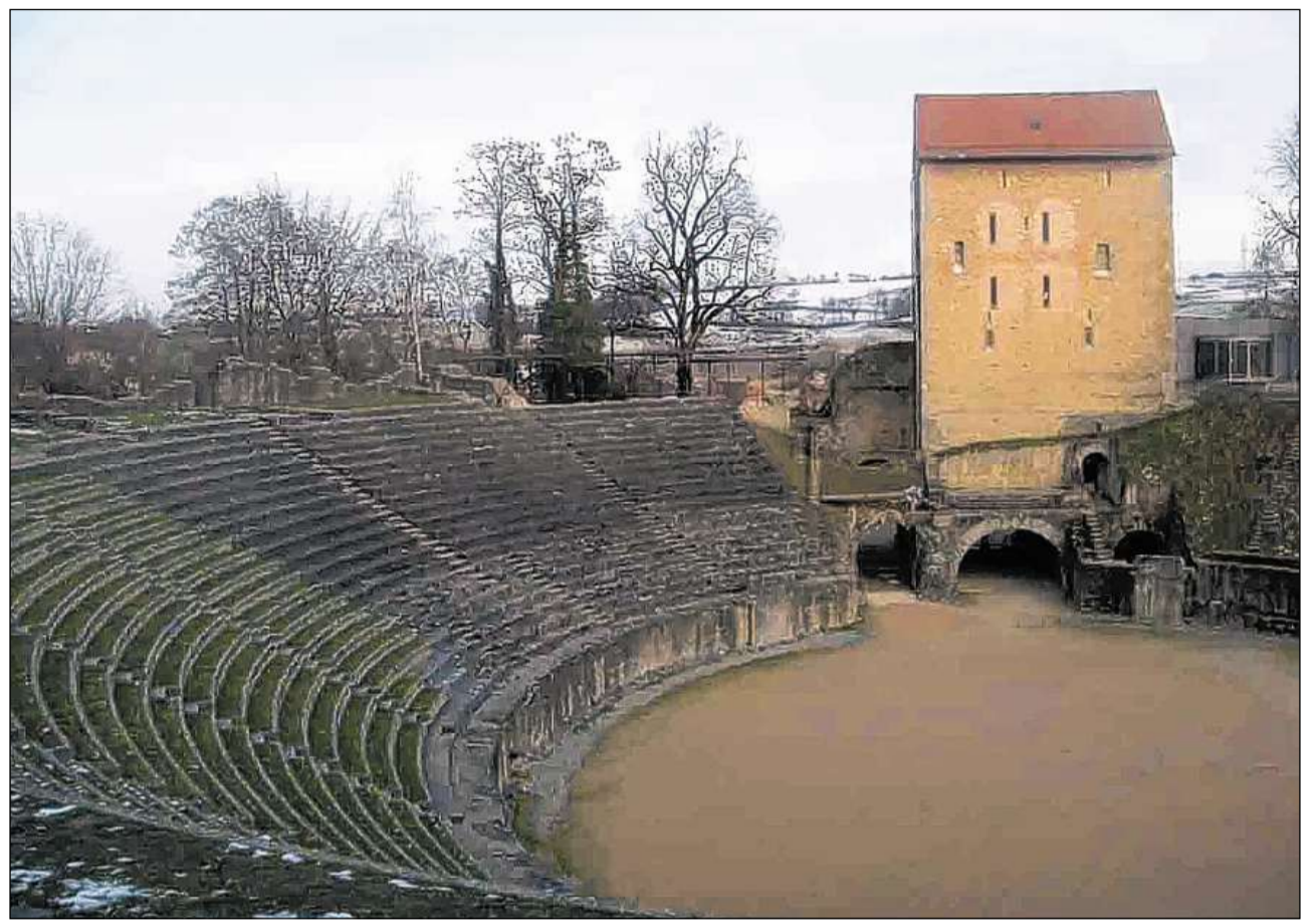
L'amfiteater ad Avenches. L'Aventicum roman furmava la pli gronda citad sin il territori da la Svizra odierna.

Enturn questas citads en sa furmads ina ventgina da vitgs ( vici ), surtut en ils lieus nua ch'ins stueva chargiar e stargiar marganzias, sco a Lousonna-Vidy ed a las cruschadas da las grondas rutas, sco ad Urba (Orbe). Il terren enturn la Colonia Iulia Equestris han ins distribuì als veterans da la chavallaria da singulas legiuns, tut il rest da la champagna è vegni partì en parcelas, mintgina cun entamez la dimora dal proprietari, la villa . Tschients da questas villas han ins puspè chattà, surtut cun agid da la