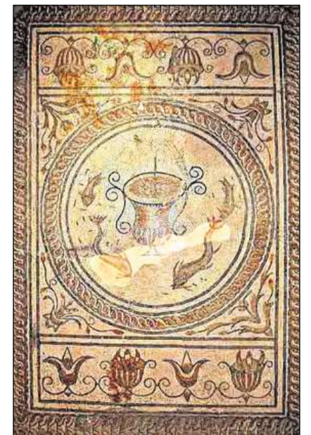
Palantschieu da mosaic ad Augusta Raurica – ina da las bieras perditgas da la cultura romana en Svizra.

Il volumen considerabel da l'architectura (er quai in novum per il territori) producida directamain u indirectamain tras ils Romans, n'avev ins mai pudì realisar senza mastergnants indigens ch'avevan emprendì las novas tecnicis da construcziun. En tut las spartas e sin tut ils stgalims sa sviluppa damai in'activitad locala. Ils lavuratori da las villas produceschan ils objects da mintgadi per lur abitants e per quels dal conturn, entant ch'en las citads s'installeschavan lavuratori pli specialisads cun ina clientella pli vasta; là han ins chattà plirs objects (surtut da bronz) cun in aut nivel. Observond l'art e la cultura ves'ins co che las tradiziuns celticas e romanas en sa maschadadas e co che l' interpretaziun romana (vul dir l'isanza dals Romans d'integrar en l'atgna religiuon diuus esters tras