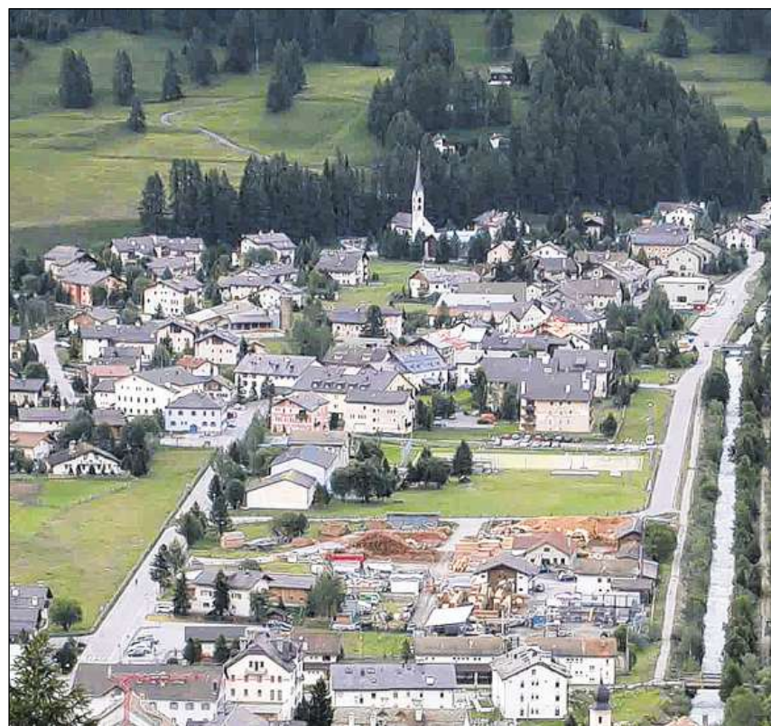
La Punt (davantvart) e Chamues-ch (en il fund) furmavan oriundamain dus vitgs separads.

Il LIR cumpiglia bundant 3100 artgels (geografics, tematics, artgels da familias e biografias) davart l'istorgia grischuna/retica e la Rumantschia. Editura: Fundaziun Lexicon Istoric Svizzer; versiun online: www.e-lir.ch ; versiun stampada: www.casanova.ch u en mintga libreria.