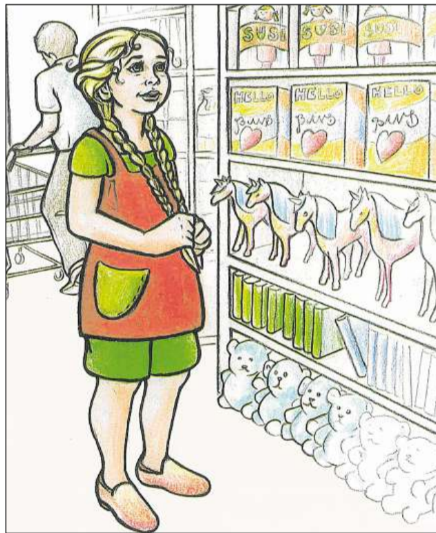
Po Jana propi cumprat cun la carta da plastic tut quai ch'ella vul?

chatta.ch/?id=1338&hiid=1904 www.chattà.ch