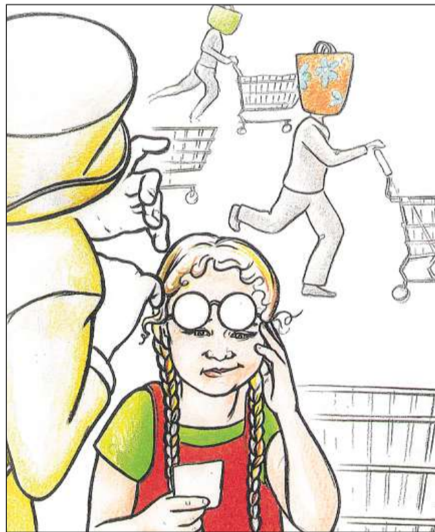
Ils egliers da Sapperlot gidan a vesair il mund dal consum e dals daners cun auters egls.

Offertas spezialas ed acziuns ans intimechan da far cumpras spontanais. Cun la cumpra – uschia sugereschan ils slogans – vegn augmentada la popularitad, il plashair e la qualitat da viver. Uffants sa laschan entusiasmar spert. Perquai ston els empendar co ir enturn cun la reclama. Cun metter en dumonda criticamain la reclama gidais Voss uffant a sviluppar in'atgna opiniun. Analisai ensemen cun Voss uffant