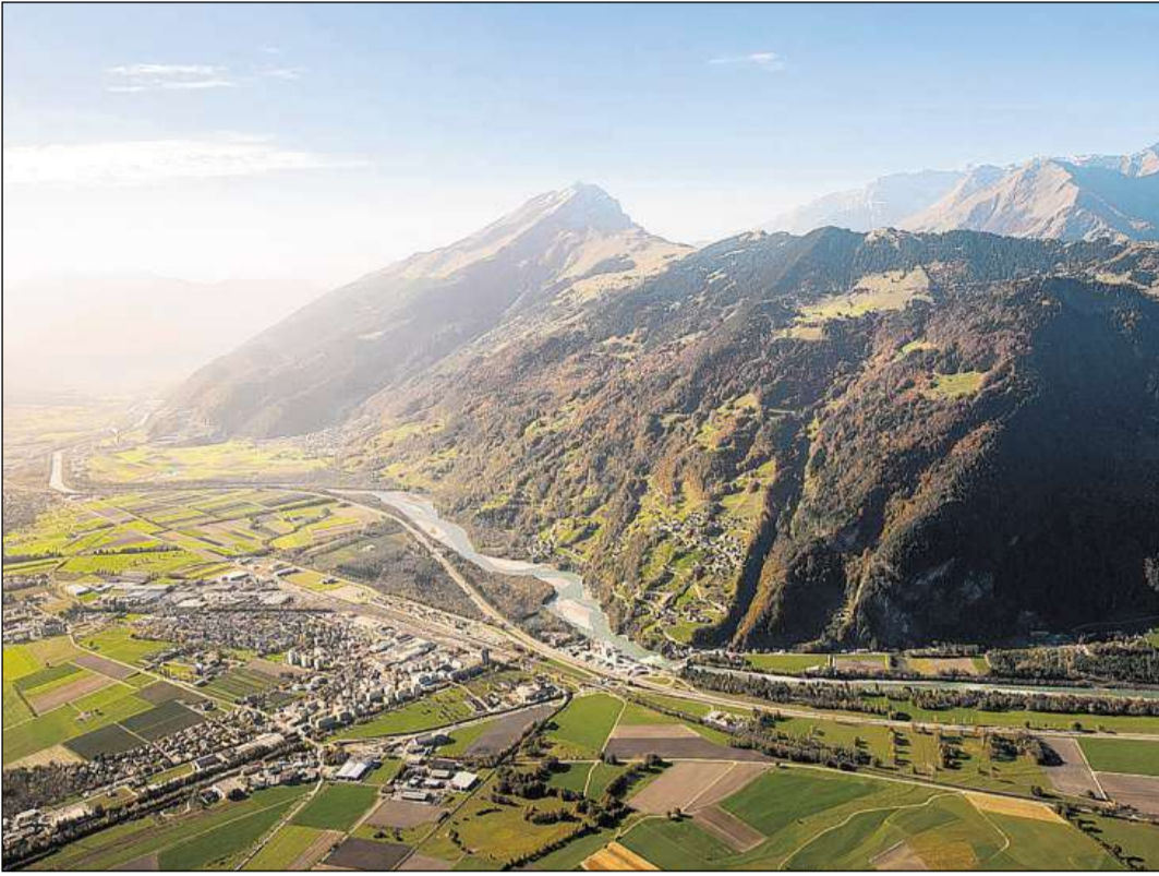
Il vitg da Landquart cun ina part dad Igis. Da la vart sanestra dal Rain sa chatta Mastrils sin la spunda ed en il fund ves'ins il Calanda.