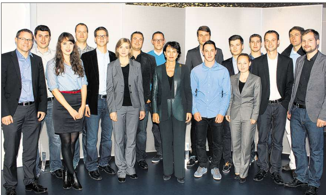
Mattas e mats da la pcd giuvna grischuna cun cussegliera federala Doris Leuthard.