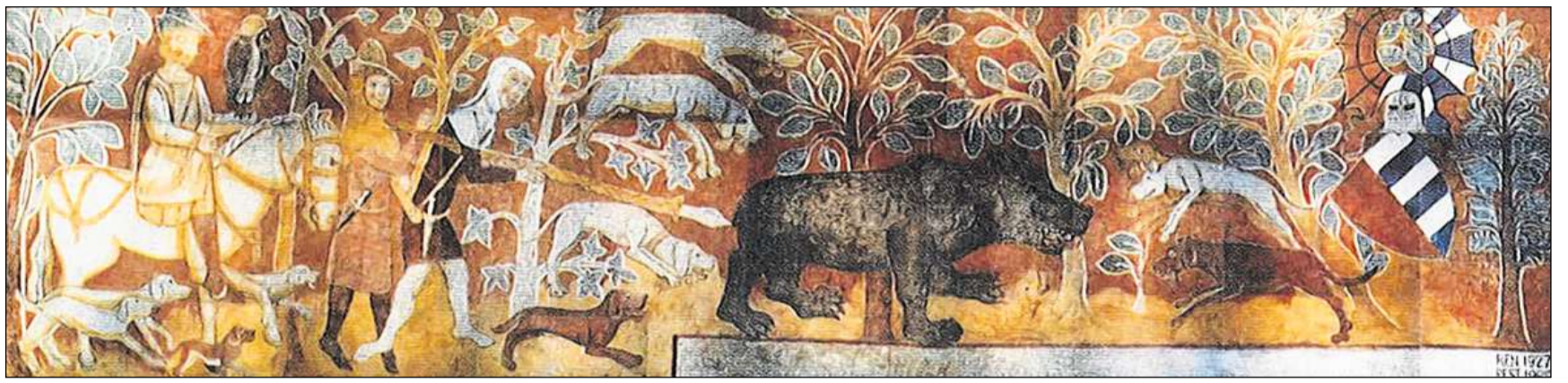
Chatscha d'urs medievala. (Maletg mural al chastè da Razén, ca. 1350).

A partir da là valeva il dretg da commember e tar quel tutgava era la chatscha. In commember cumplain era quel che possedeve «agen fim» (in agen bain). Ins pudeva pia ir a chatscha ed a pestga libramain entaifer ils cunfins da l'atgna dretgira, vul dir dal cumin che correspunda pli u main als circuls odierns. Ils vischins d'auters cumins valevan percenter sco persunas d'ordaifer e vegnivan era tractads e chastiadts correspudentamain sch'els gievan a chatscha sin territorii «ester».