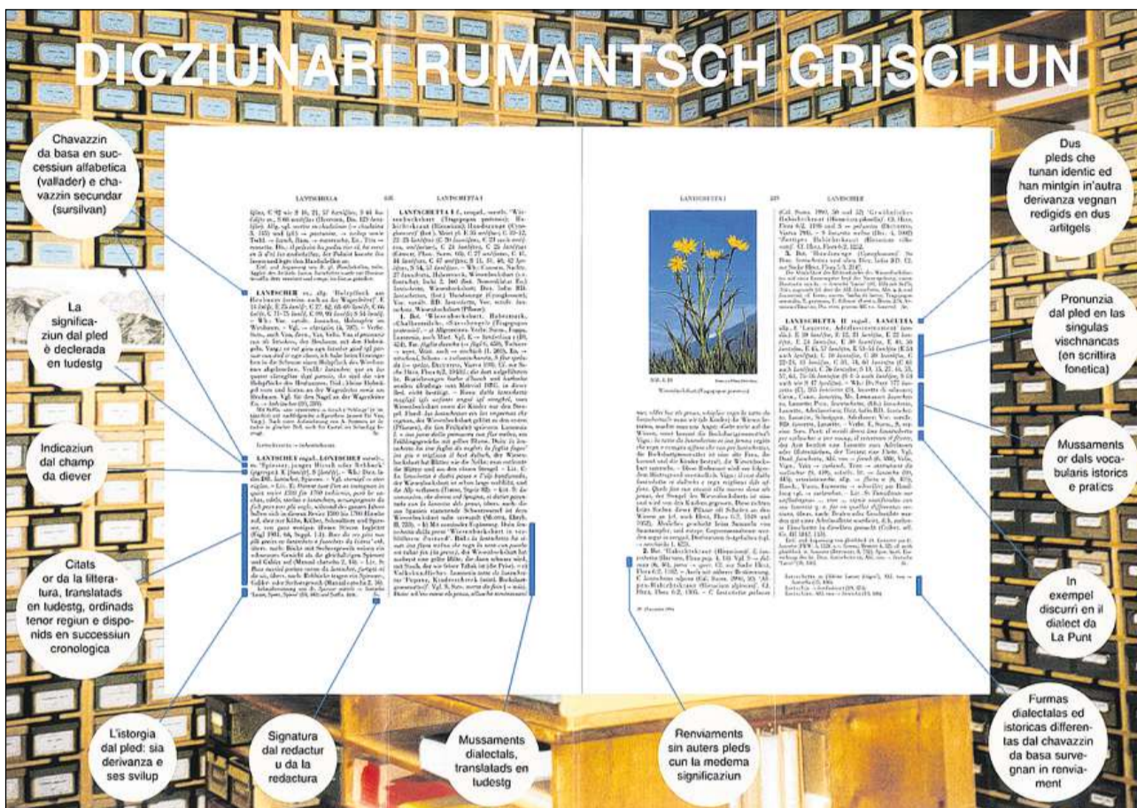
Invista en la structura d'in artitgel.