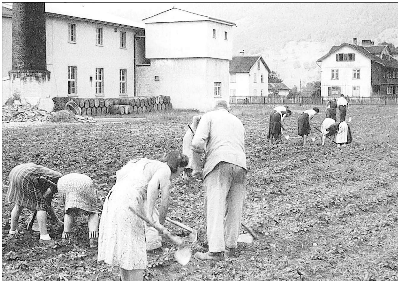
Cultivaziun da tartuffels sin l'areal da la fabrica da palpieri a Landquart.