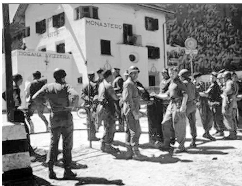
Schuldada americana il 1945 al cunfin svizzer a Münstair suenter la liberaziun da l'Italia.