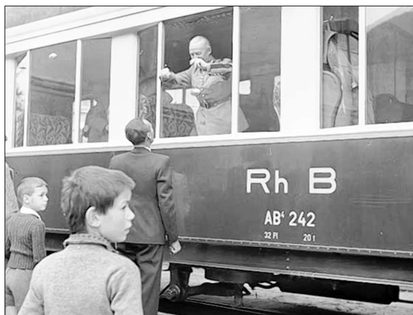
General Guisan sin viadi d'inspeziun en il Grischun.