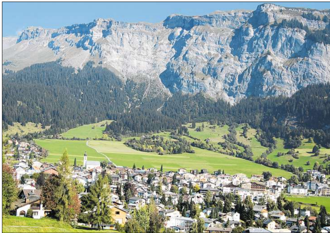
Flem è oz ina da las destinaziuns turisticas las pli enconusentas dal Grischun.

Ruina da chastè en il guaud a l'ost da Fidaz