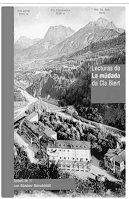
Differentas ediziuns tgiradas da l'Archiv svizzer da litteratura.

Cun questa soluziun dispona l'ASL dapi il cumenzament da relaschs impurtants sco quels da Corinna Bille, Blaise Cendrars, Maurice Chappaz, Annemarie Schwarzenbach e Carl Spitteler, da la remartgabla correspondenza da Hermann Hesse e da l'Archiv Rilke svizzer. Questas collezions han dapi alura pudì vegnir amplifitgadas ed enritgidas constantmain. Cun passa 250 fonds (per part parzials) d'auturas ed auturs svizzers e pli che 60 bibliotecas d'autur poseda l'ASL la collezium la pli impurtanta da documents relativs a las litteraturas svizas dal 20avel e 21avel tschientaner.