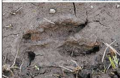
Fastizs da tshieriv.

ils pli ferm defendan «lur» vatgas vehementamain cunter l'attatga da la «concorrenza». Durant tals cumbats poi era dar blessads e mintgatant schizunt in taur mort. Per il solit gudognan ils taur-tshieriv cun las meglras premissas corporalas e betg senz'auter quels cun las pli grondas cornas.