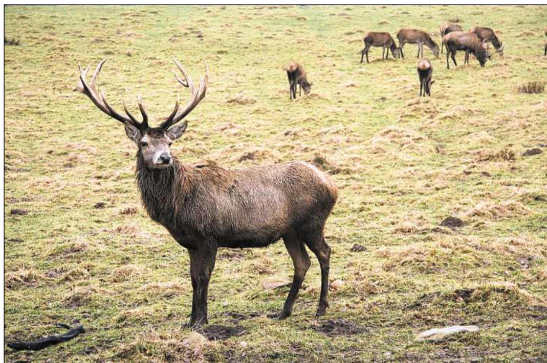
Il temp da chalur s'avischina.