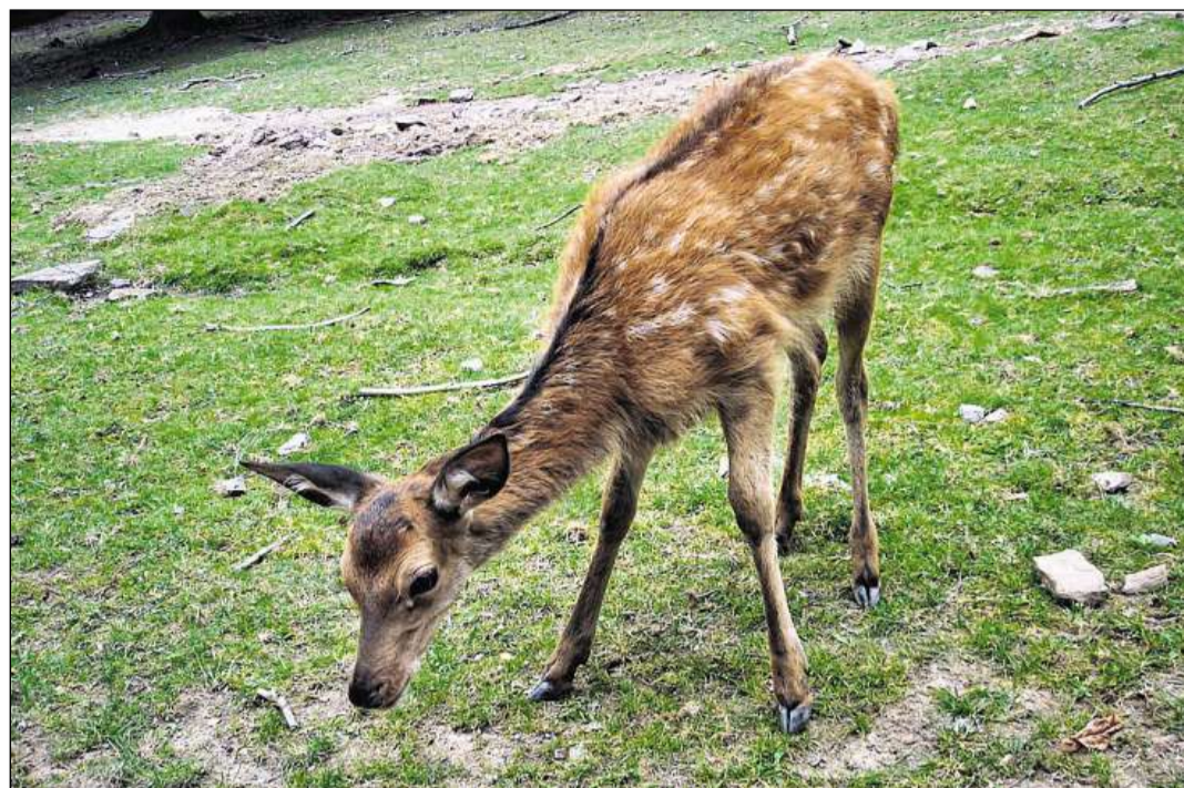
Ils tachels dals vadels svaneschan en il decurs da la stad.