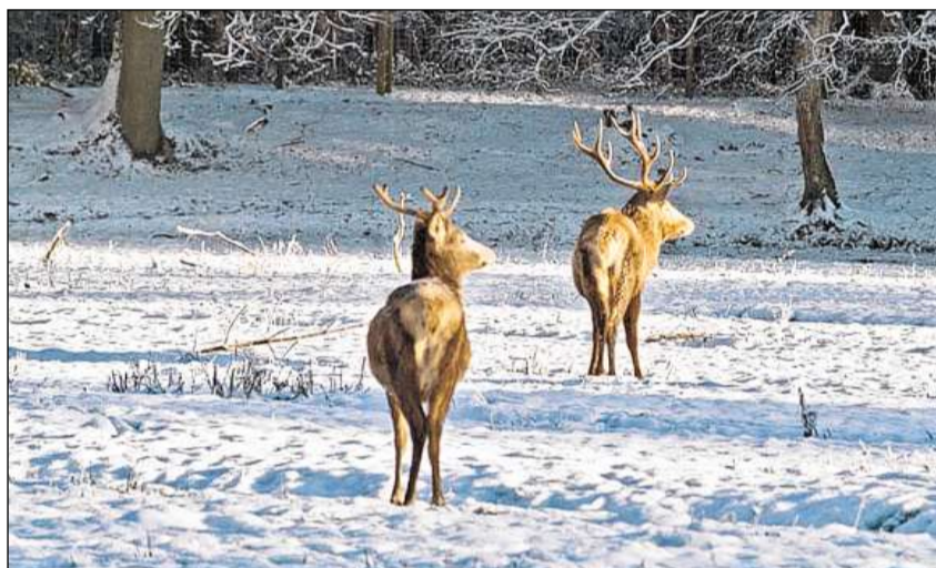
L'enviern passentan ils tshierivs en il fund da la val u sin spundas suleglivas.

cornas surtratgas d'ina pel cun ferma circolaziun dal sang (l'uschenunà bast). Cura che la creschientscha è terminada, sfruschan (spelatschan) ils tshierivs giu la pel, numnada pelatsch, vi da plantas e chaglias. Tras restanzas da sang e da terra survegnan las cornas lur color brina.