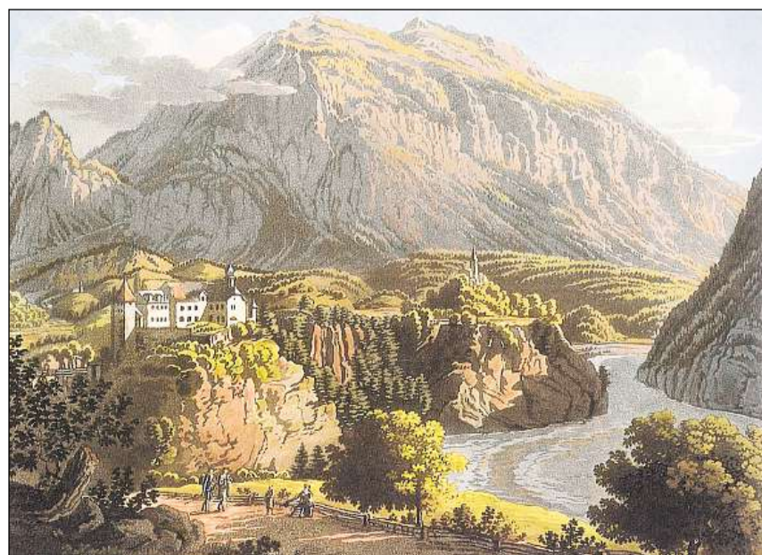
Il chastè da Razén – il center administrativ da l'anterior signuradi.

Il LIR cumpiglia bundant 3100 arttgels (geografics, tematics, arttgels da famiglias e biografias) davart l'istorgia grischuna/retica e la Rumantschia. Editura: Fundaziun Lexicon Istoric Svizzer; versiun online: www.e-lir.ch ; versiun stampada: www.casanova.ch u en mintga libreria.