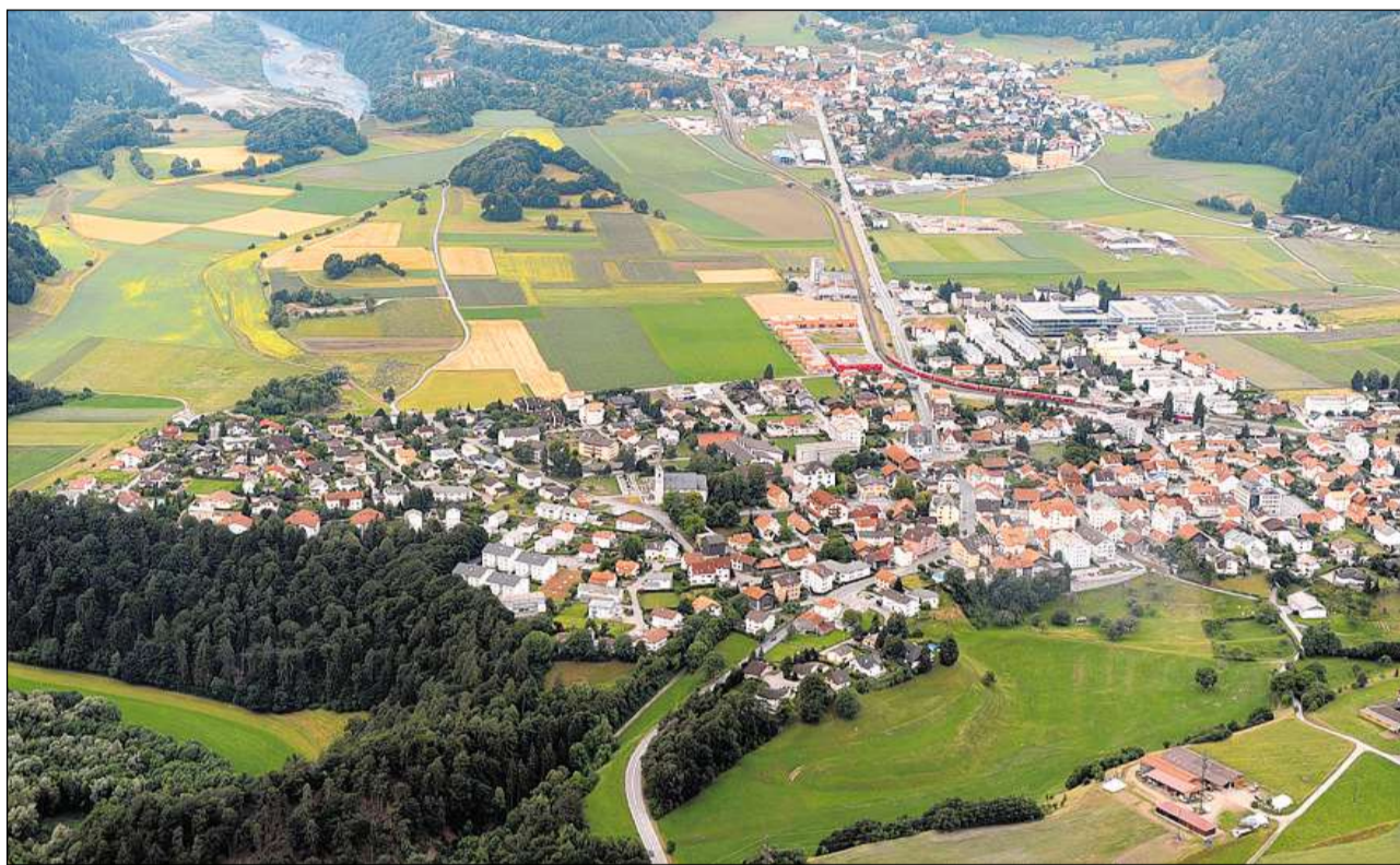
Oz tutgan Bonaduz e Razén tar l'aglomeraziun da la regiun da Cuir.

Gia enturn il 1550 possedeve Panaduz l'Alp Ramuz da l'autra vart dal Pass dal Cunclas. Fin enturn il 1850 è in ils purs sa deditgads en parts egualas a la cultivaziun da granezza ed a l'allevament da muvel ch'è alura daventà pli impurtant. Tranter il 1687 ed il 1773 ha existì a Panaduz la Stamparia Maron (era Moron). Il 1819 è la vischnanca da Panaduz vegnida annectada ensemen cun il signuradi da Razén al chantun Grischun. Il 1874 è sa furmada la vischnanca politica tras separaziun da la vischnanca burgaisa. L'amplificaziun da la Via Sut (Spleia e S. Bernardin) en il 19avel