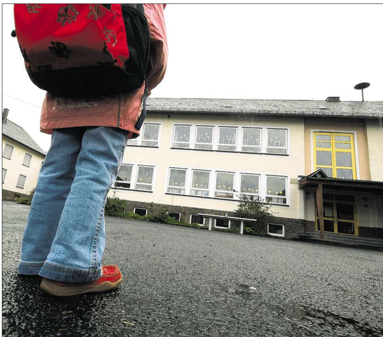
A l'entschatta d'ina lunga carriera scolastica.

Per regla entran las scolaras ed ils scolaras durant il 12avel onn da vegliadetgna en il stgalim secundar I. Las prestaziuns a la fin dal stgalim primar sco er per part in examen d'admissiun decidan davart l'attribuziun ad in tscher nivel da prestaziun dal stgalim secundar I.