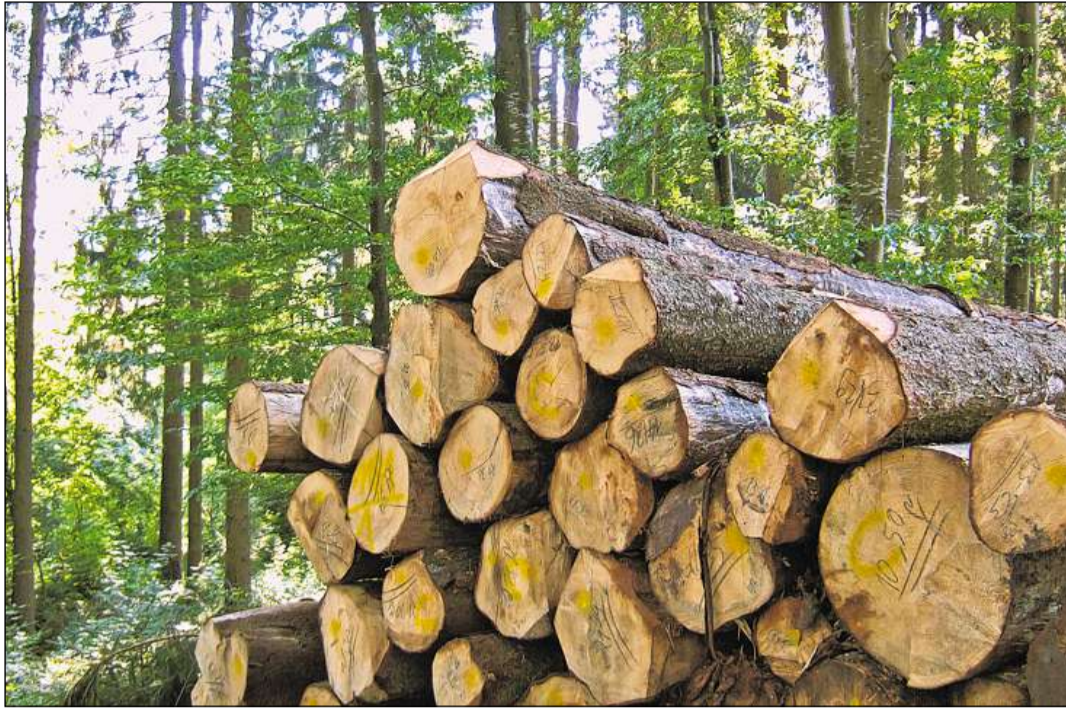
Lain – ina materia prima tschertgada da vegl ennà.