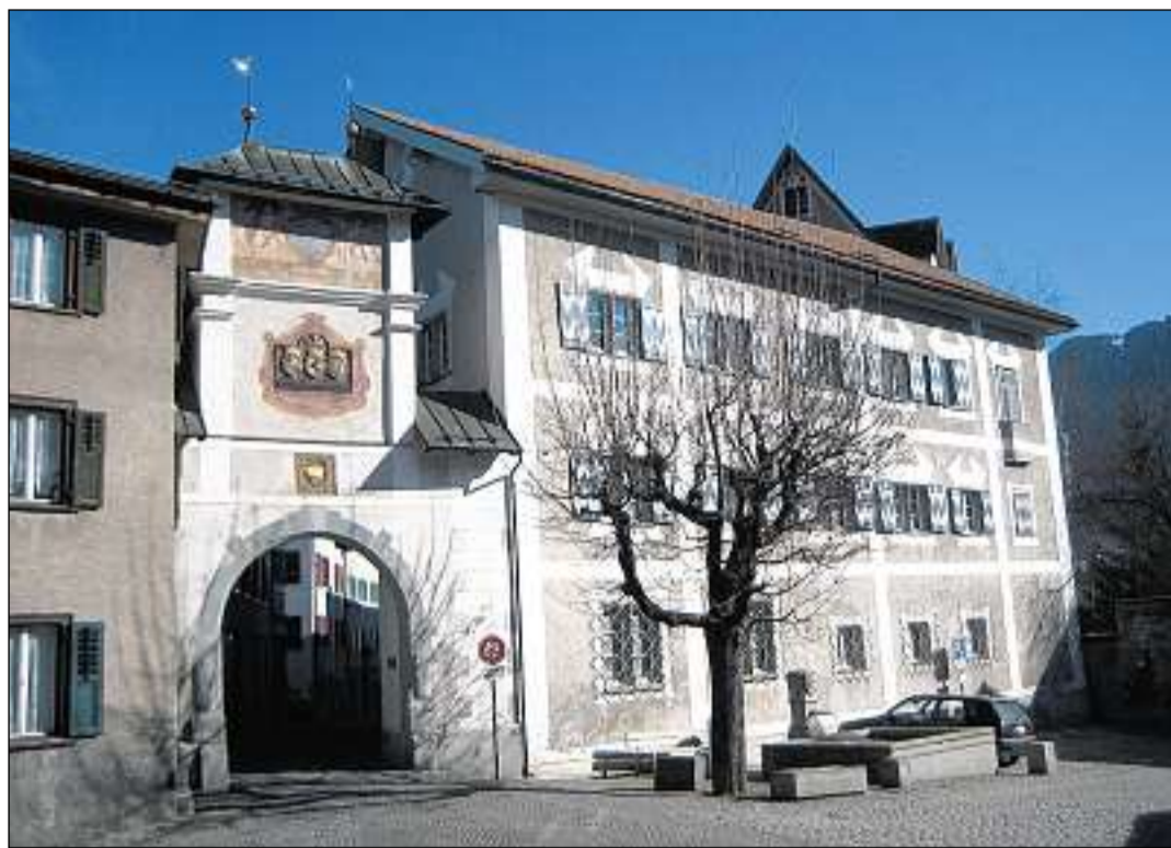
Porta Sura a Glion cun las vopnas da las Trais Lias.