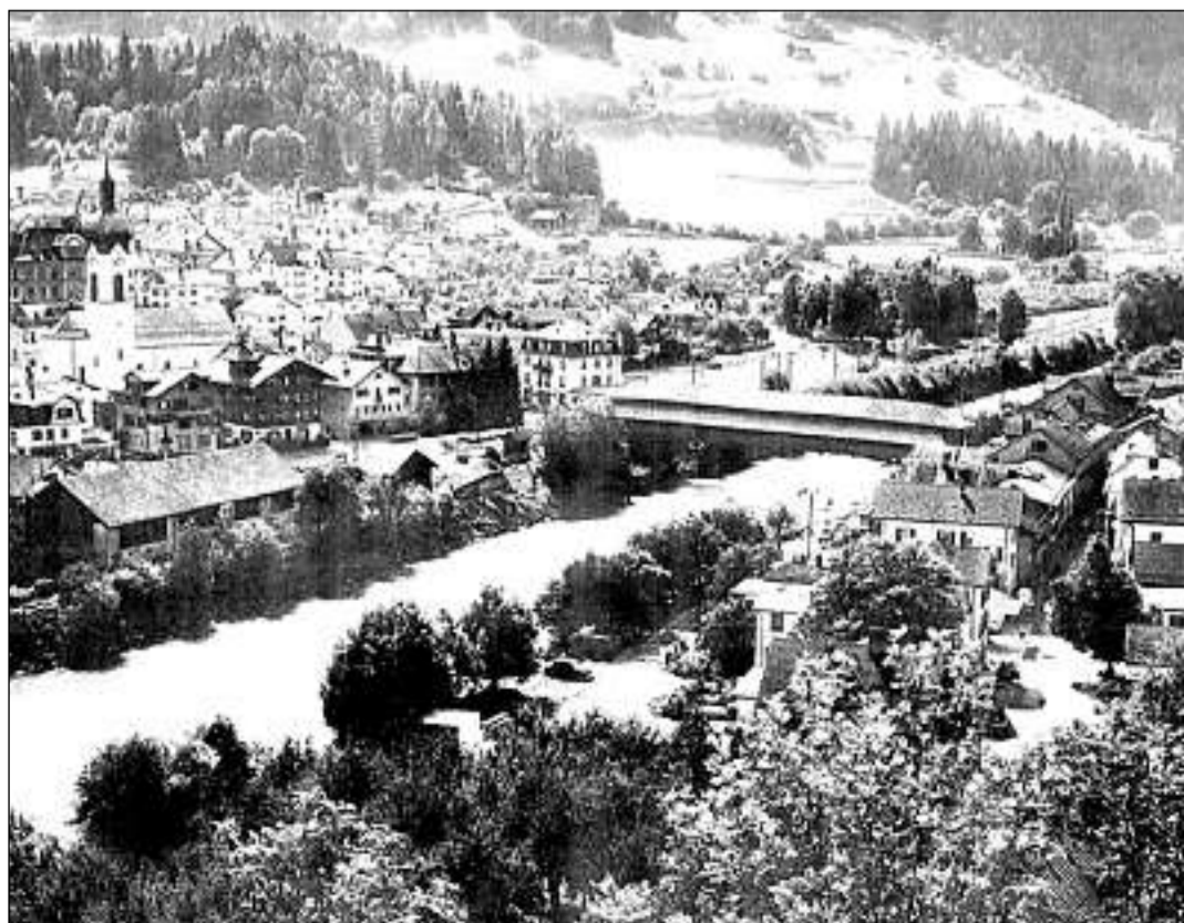
La punt da lain sur il Rain è vegnida demolida l'onn 1961.