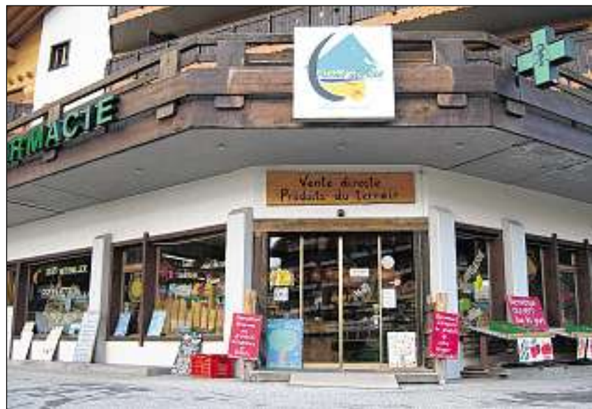
Ils megliers fritgs venda il bain «Nand'abricot» en l'atgna stizun.