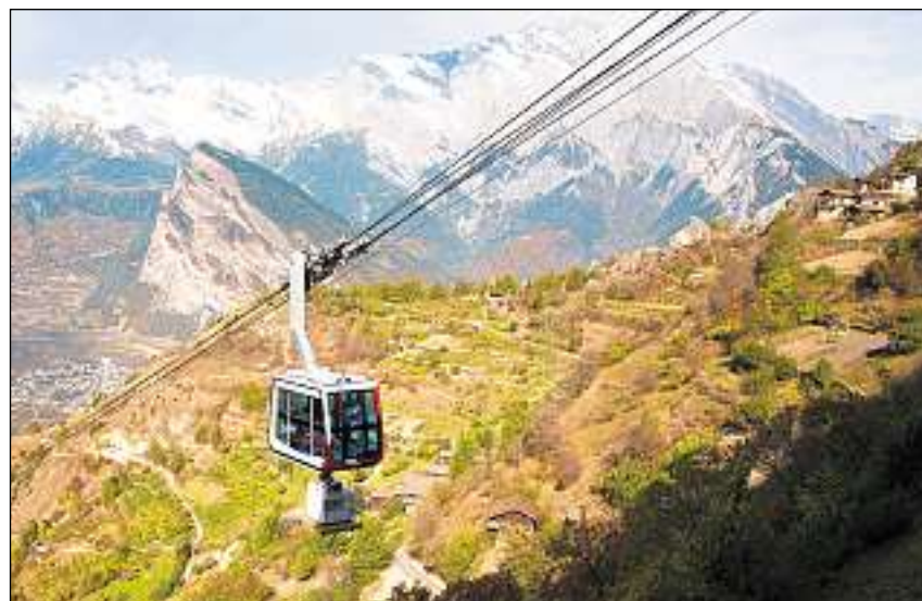
Tgi po ir en biro cun ina pendiculara? Ils inschigners da «Mecatis» en il Vallais.