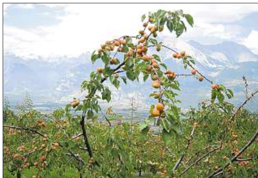
Sper apricosas cultivescha «Nand'abricot» anc ventg autras sorts fritgs.