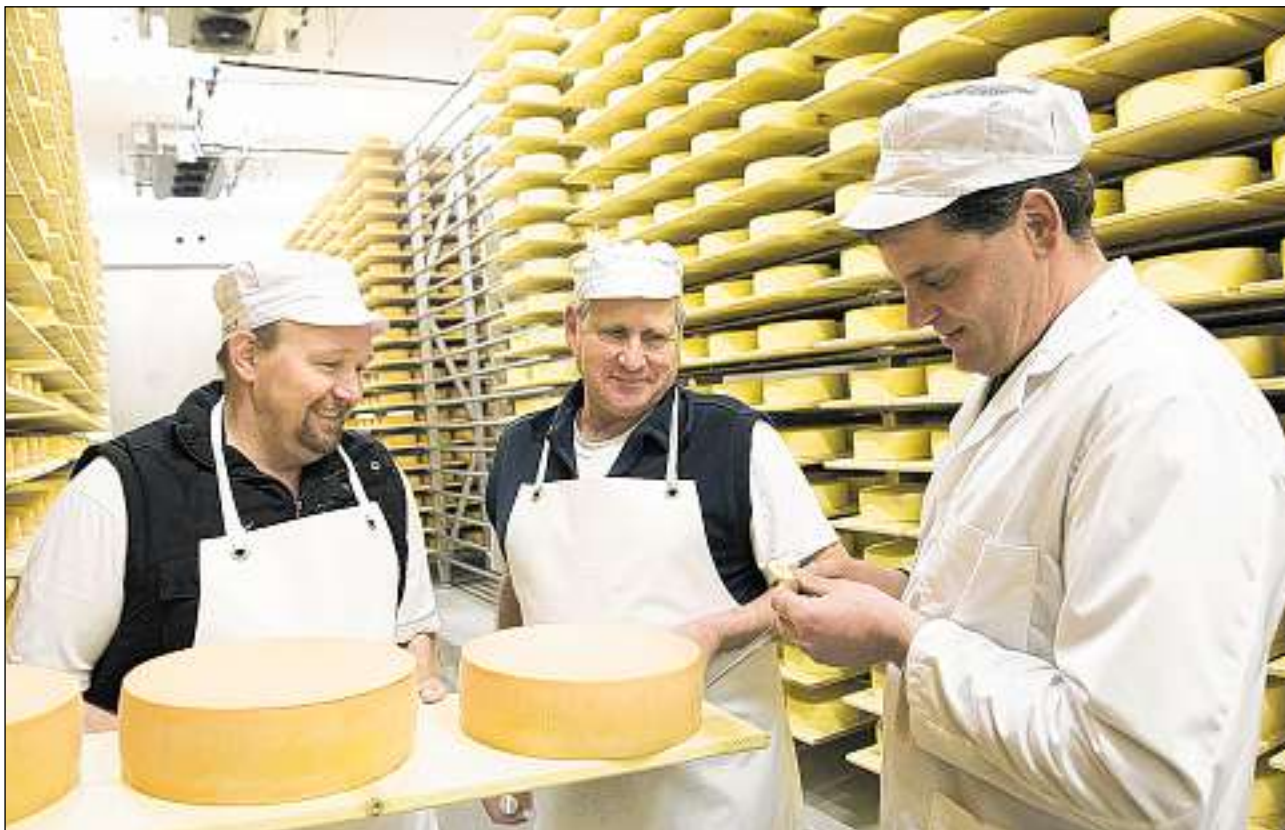
Loschs sin lur product – ils purs da Nufenen furneschan chaschiel fin a Berlin.

Il «Prix Montagne» vegn sponsurà da las duas organizaziuns: Agid svizzer per la Muntogna e Gruppa svizra per las regiuns da muntogna.