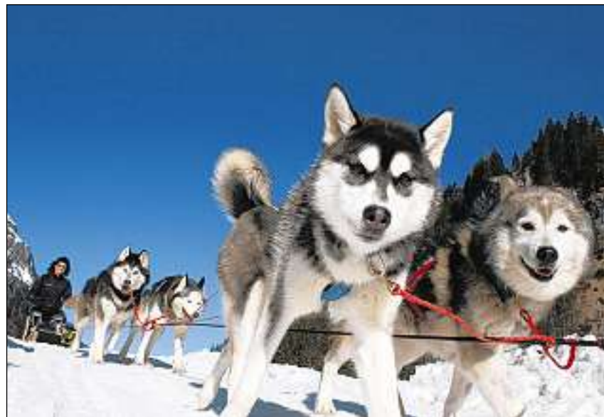
Las aventuras cun schlieusa vegnan reservadas per excursiuns da firmas.