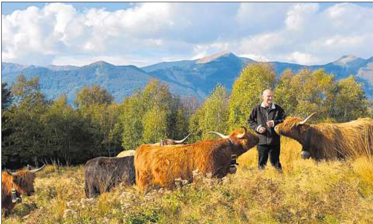
600 vatgas scottas pasculeschan en il Tessin sin pastgiras che creschissan en uschiglio.