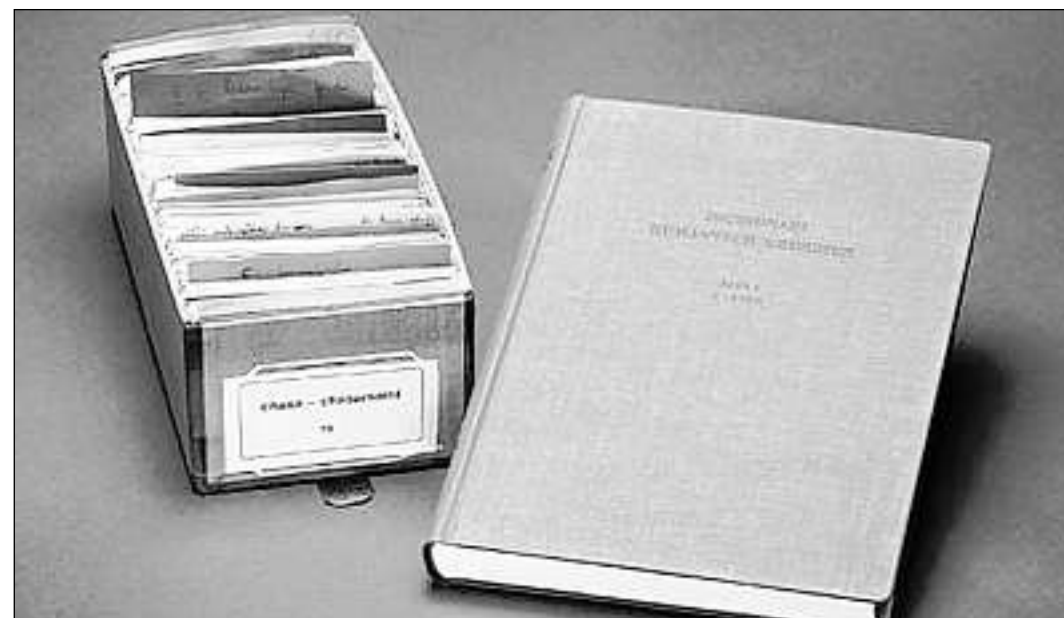
Las infurmaziuns rimnadas en las cartotecas èn la basa per la redacziun dal dicziunari.