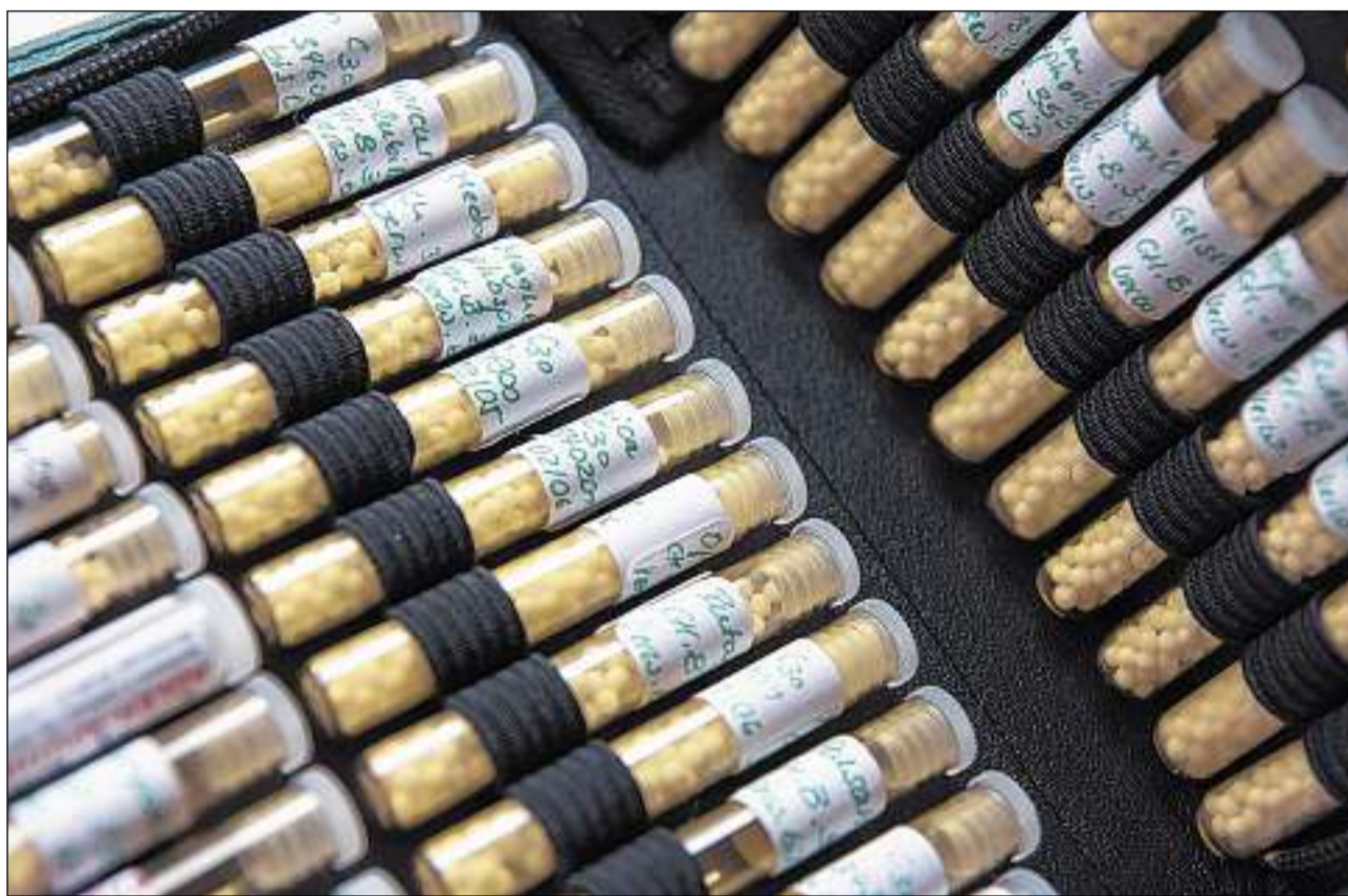
Globuli – omeopatia sco tuts l'enconuschan.

Il cuntrari da la glista da medischnas furma l'uschenumnà repertori omeopatic. Quest register na renviescha betg dals medicaments als sintoms, mabain dals sintoms als medicaments. Tar mintga sintom da malsogna pussaivel vegnan enumerads ils meds omeopatics che han evocà tar il pro-