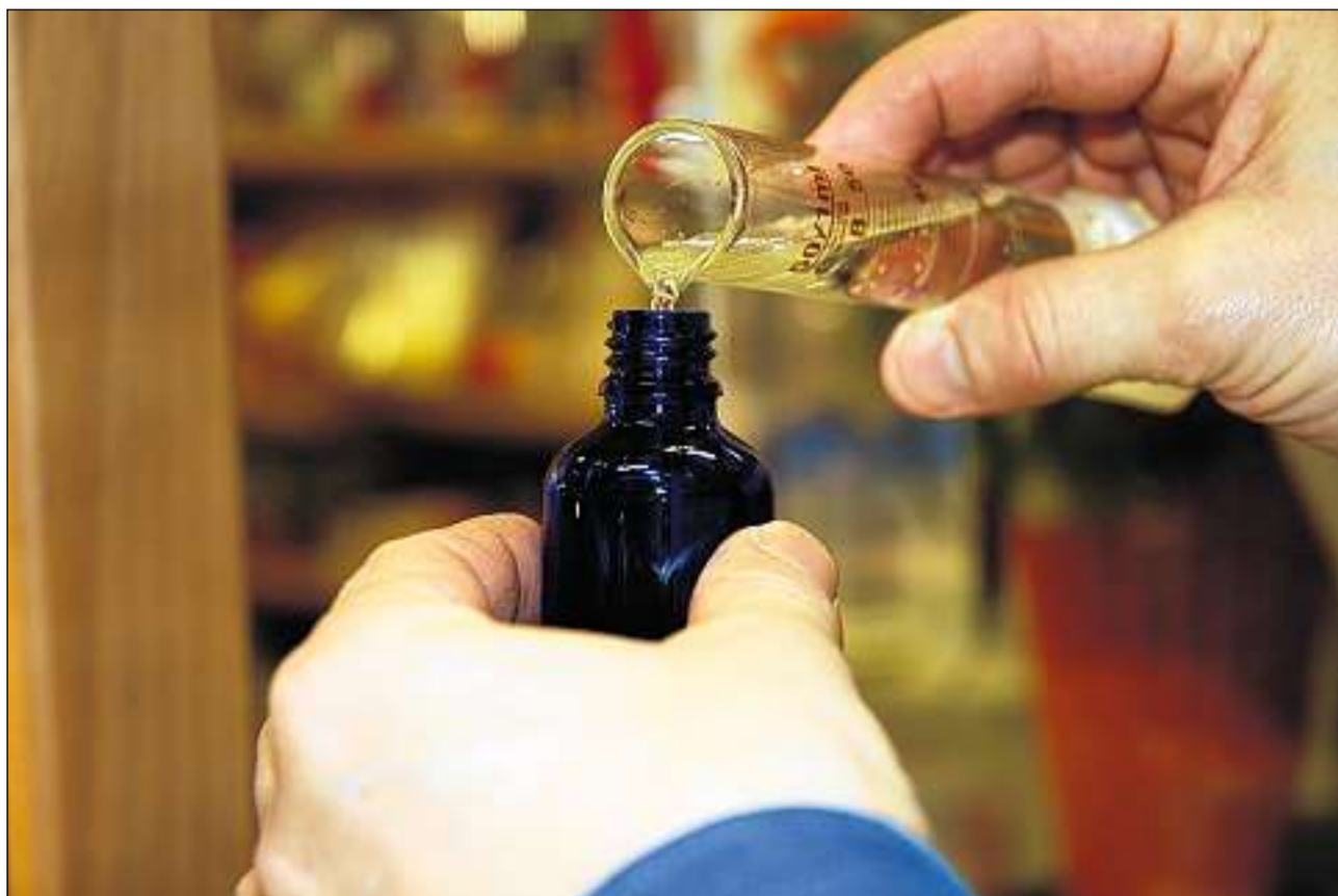
Med omeopatic suenter il process da potenziar u dinamisar.