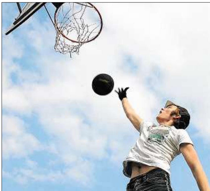
Streetball – ballabasket sin via ed a medem temp in'entira cultura da giuvenils.