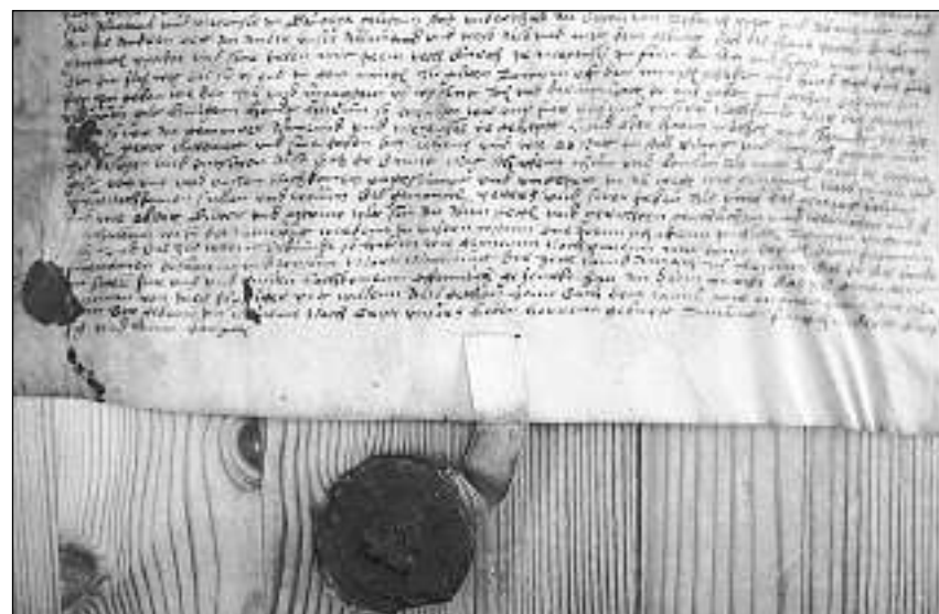
Barat da bains en Val Medel il 1539 – la pergiamina cun il sigil dal cumin da la Cadi sa chatta en l'archiv da Medel.

ei in lodeivel oberkeit staus sforzaus da saconsiglia ensem ad urdar, co ei sei da far. Ad as[ch]ia han ei enflau per bien, ca mincha visnaunha dei sin in tal gij ordenar 3 u 4 dil oberkeit u visinß sil liug a visitar e urdar, co il faig steti. Suenter quei il on 1732 ils 19 de fanadur en stai urdenai 4 dil lodeivel oberkeit da Muste ad erra 3 dil lodeivel oberkeit da Tuietz a con visins lau tier sin ils cunfins u tiarmß sper la strada regala, a quels visitau e enconoschiu valeivels. Suenter quei en ei i vinavon ad han enflau in auter per si per il uault sin in crest, a quels enconoschu per valeivels.