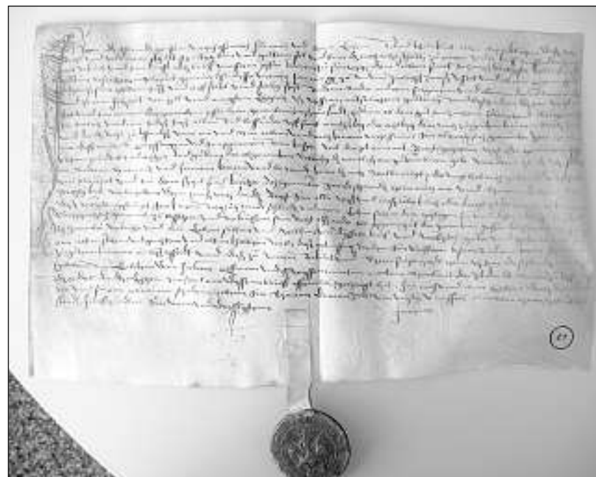
Brev da daivet dal 1539 – la pergiamina cun in sigil dal cumin da la Cadi sa chatta en l'archiv da Sumvitg.