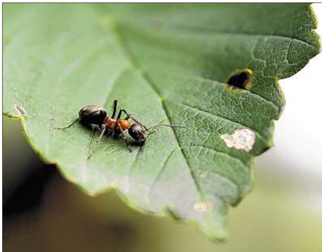
Furmicla da guaud cotschna.