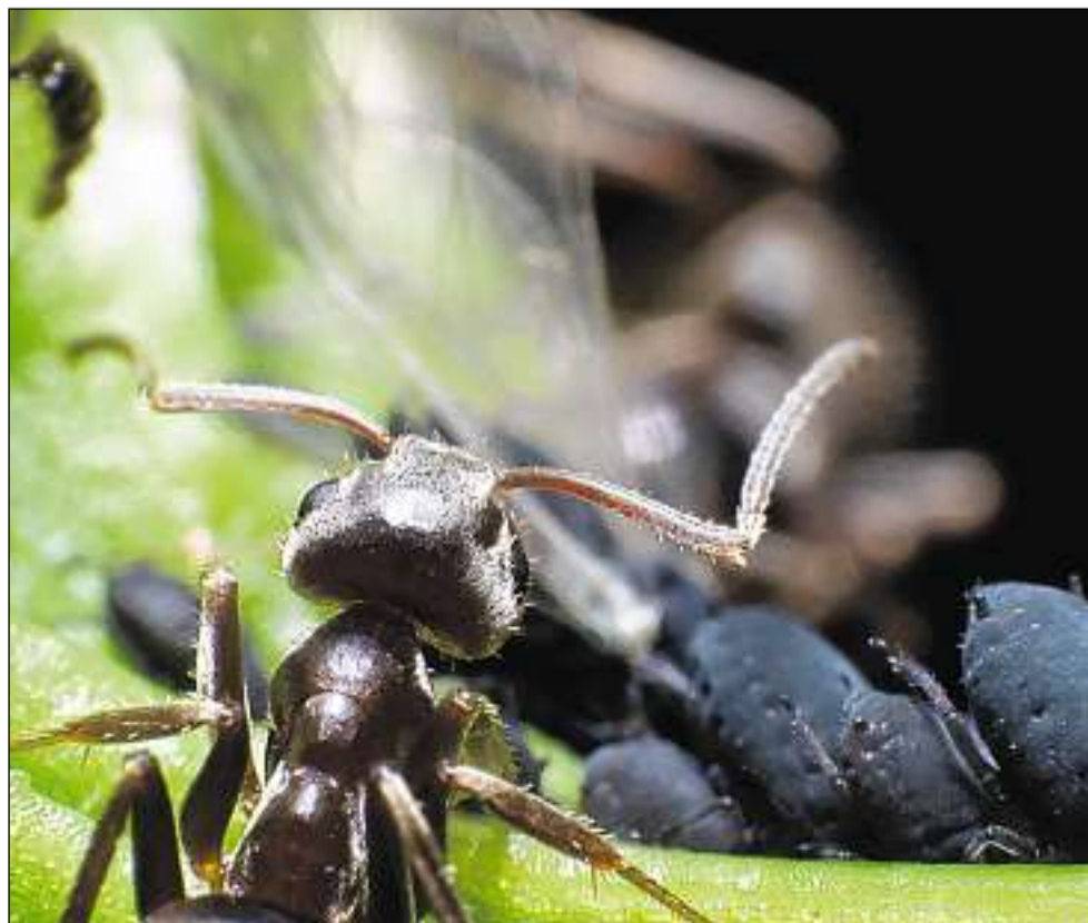
Ina lavurera pertgira ils plugls da feglia.