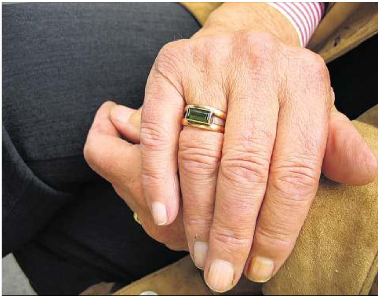
Largias en la memoria e fadias da s'orientar? In'examinaziun a temp po dar scleriment.

Tge è la differenza tranter largias occasionalas en la memoria e sintoms d'ina malsogna da demenza? I vala en mintga cas la paina da laschar far a temp in'examinaziun: ella permetta a la persuna pertutgada da savair dapli davart las midadas observadas e da far ina clera diagnosa che furma ina basa impurtanta per instradar – en cas da basegn – ils dretgs pass