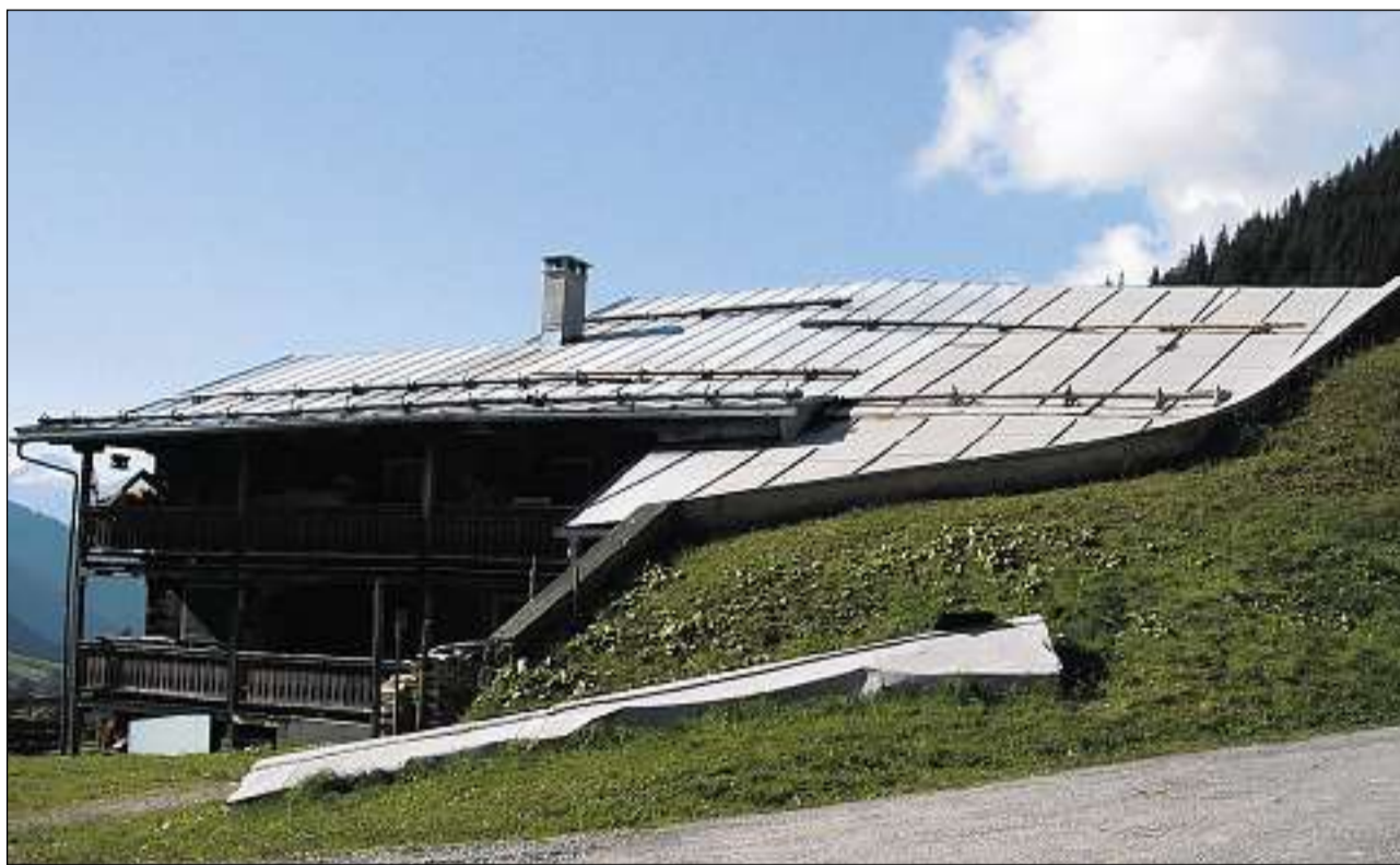
Chasa cun cugn da lavinas.

Tge pon ils umans che vivan en ina zona da privel da lavinas far per sa proteger cunter questa forza da la natira? Tar la vischnanca (plan da zonas) u tar ils posts spezialisads chantunals per privels da la natira vegn ins a savair sche l'atgna chasa sa chatta en ina zona periclitada. Sin chartas da privel da lavinas èn territoris, nua ch'igl exista in scumond da construir, marcads cun cotschen. Edifizis