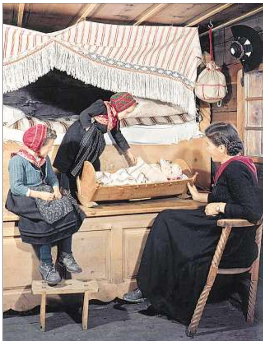
Stiva da durmir en la Val d'Herens.

En Svizra èn las fotografias da Peter Ammon vegnidas publicadas en revistas emnilas u decoravan las stivas en furma da chalenders. In pèr maletgs èn schizunt vegnids stampads a l'exteriur, ma da quels èn numerus restads enavos sin las redacziuns. Il fotograf n'aveva betg fatg in register dals dias furnids ed als ha per part er emblidà. Ils maletgs che vegnivan enavos eran savens en in stadi miserabel, uschè ch'el na pudeva betg pli duvrar els. Grazia a l'agid dal figl Emanuel Ammon pon ins oz malgrà tut ammirar 125 fotografias en in cudesch che preschenta ina part da la Svizra da pli baud. L'autur di: «Jau hai grond plachair ch'els umans che ma stattan a cor n'èn ussa betg pli mo ina sumbriva dal passà, mabain vivan vinavant en quest cudesch.»