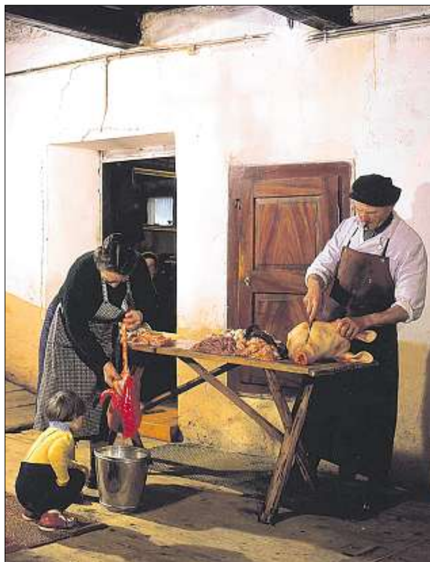
Batgaria en Engiadina Bassa.