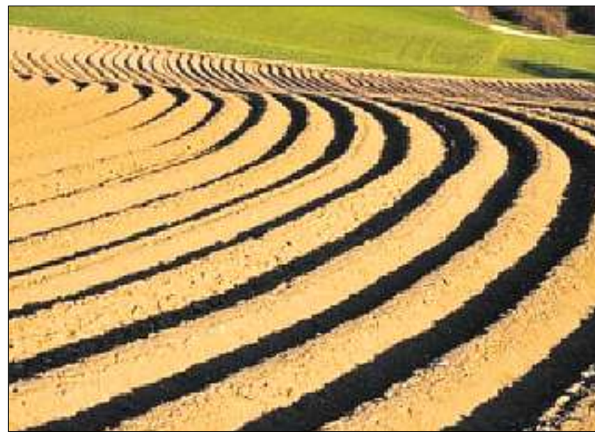
En Svizra è la surfatscha cultivada sa sminuida ils davos 100 onns.

La gronda part dal terren agricul vegn utilisada sco prà (prada e pastgira). La cumpart dals prads a la surfatscha totala è restada stabila ils ultims 100 onns, quella dal terren cultivà perencunter è creschida. Tant il 1905 sco era il 2005 è la grondezza stada la pli impurtanta cultura arabra da la Svizra. La cumpart da la cultivaziun da grondezza a l'entir terren cultivà muntava l'onn 1905 a stgars 55%, il 2005 a radund 60%. La cumpart da la surfatscha che na vegniva utilisada ni sco prà ni sco terren cultivà è sa sminuida dal 1905 en fin il 2005. Da quella categoria fan per exempel part las vignas ed ils prads da sternim. Las vignas a las costas suleglivas han savens stui far plaz a las surfatschas da terren abità ed ils prads da sternim èn per gronda part vegnids drenads ed utilisads autramain.