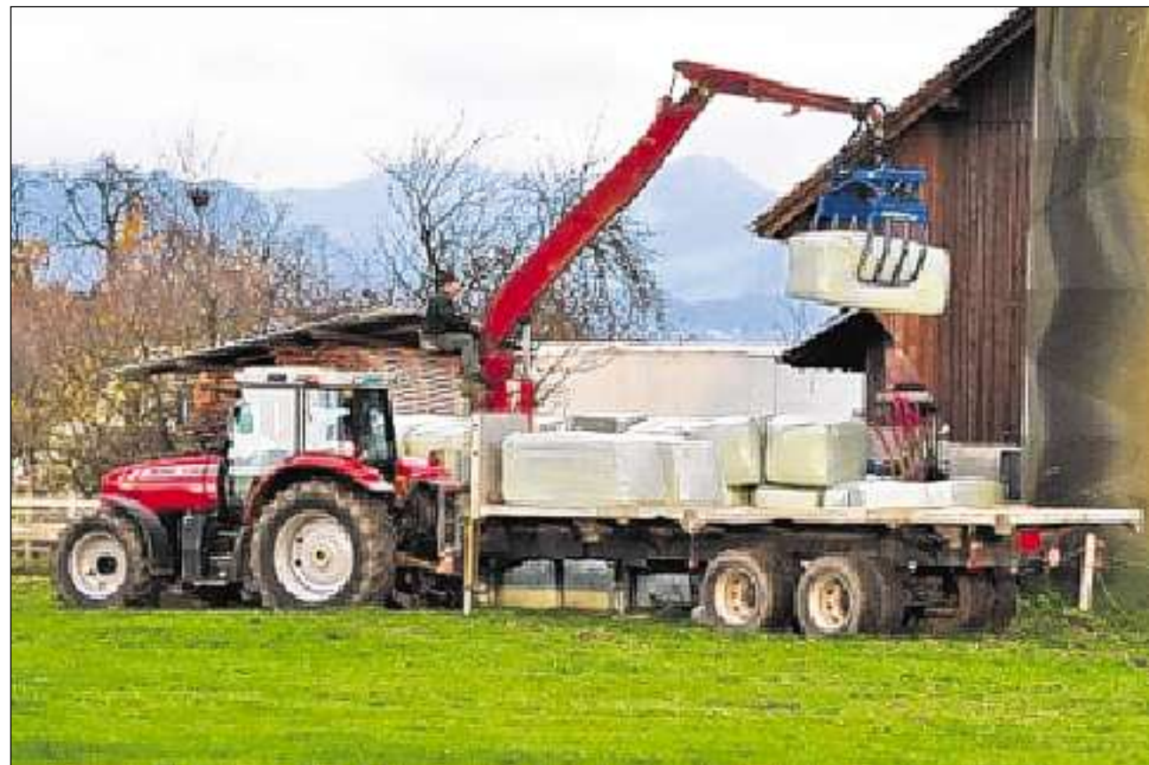
La mecanisaziun da l'agricultura è sa sviluppada intensivamain.

Il 1905 dumbraiva in muvel en media 7 chaus biestga, il 2005 34 chaus. L'onn 1905 eran ils chantuns Sutsilvania e Lucerna cun mintgamai 11 chaus per muvel sin l'emprim plaz, suandads dals chantuns Zug, Sursilvania e Friburg cun mintgamai 10 animals per muvel. Il 2005 è stà a la testa il chantun Giura cun 58 animals. La tratga da biestga en l'agricultura è sa sviluppada e sa midada ils ultims 100 onns a moda rasanta. Adina pli savens vegnan ils animals tegnids en stallas libras. Dapi bundant 10 onns vegn