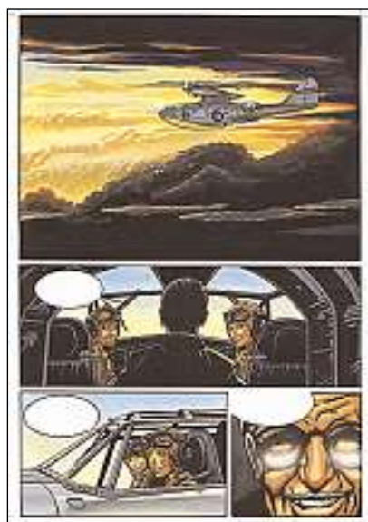
En quatter pass tar il comic: scribble, dissegn cun rispli, dissegn cun tusch, dissegn colorà.

d'ariv va per fortuna senza problems – il biplan nair è svani davos la muntogna – e l'aviun cun ils sis passagiers sa platga en il golf da l'insla. Ma avant che Maxi e Megi pon ir a tschertgar il stgazi e scuvrir tgi