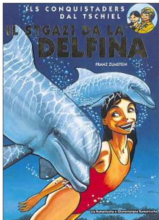
Frontispizi dal cudesch «Il stgazi da la Delfina» (2004).

Per ina pagina d'in comic dovra l'illustratur Franz Zumstein radund trais dis. Il dissegn cun rispli, il dissegn cun tusch, la coluraziun – mintga pass dovra var sis fin ogt uras temp, damai totalmain 18 fin 24 uras. Inclusive il tiel ed il fegl da guardia, che pretendan medemamain trais dis, impund'ins per in cudesch da comic da 46 paginas radund 1000 uras da lavur, ubain 144 dis u 24 emnas. Latiers vegnan anc tut las uras che l'autur dovra per rimnar material, per concepir il cudesch, per survegliar ils pass da stampa, per sesidas, referats, uras per dar autograms, lavurs da medias, corrispondenza, lavur da biro etc. En media dissegna ed edescha Franz Zumstein in cudesch per onn.