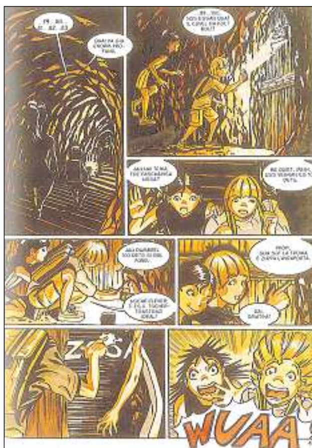
En tschertga dal stgazi èn Megi e Maxi entrads en in cuvel misterius.