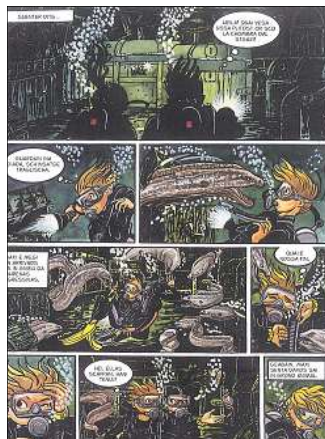
Er sut aua spetgan blers privels...