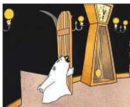
Tge spetga il furbaz Murezi davos la «porta scumandada»?

Tge schabegia cur che Gieri va tras chasa? Las quantas mussa l'ura suenter che Gieri è passà speravia? Tge color ha il toster dals spierts? Tge capita cun l'ensolver dals spierts? Tge tegna Gieri en maun? Nua van ils spierts cun Gieri? Co ha num la doctoressa? Tge color ha l'auto dals spierts?