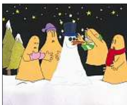
Ils pitschens spierts fan in um da naiv.