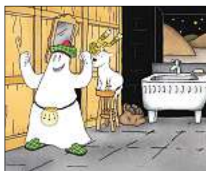
Mac Wau chatta il zup secret da Mac Gregor.