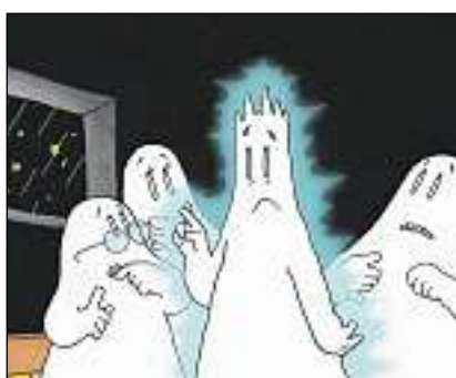
Gieri vegn tutgà d'in chametg.