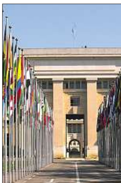
La sedia europeica da l'Organisaziun da las Naziuns unidas (ONU) a Genevra.