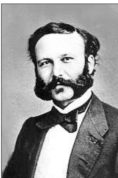
Henry Dunant (1828–1910), il fundatur da la Crusch Cotschna, sco um giuven.