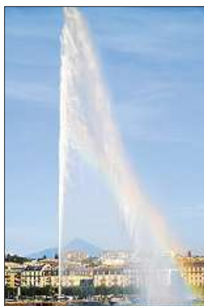
Il «jet d'eau», il segn caracteristic dal golf da Genevra.

Las Naziuns unidas han lur sedia principala a New York e trais ulteriuras sedias a Genevra, Nairobi e Vienna. A Den Haag sa chatta il tribunal internaziunal. Actualmain èn 192 stadis commembers da las Naziuns unidas; la Svizra è daventada commembra l'onn 2002.