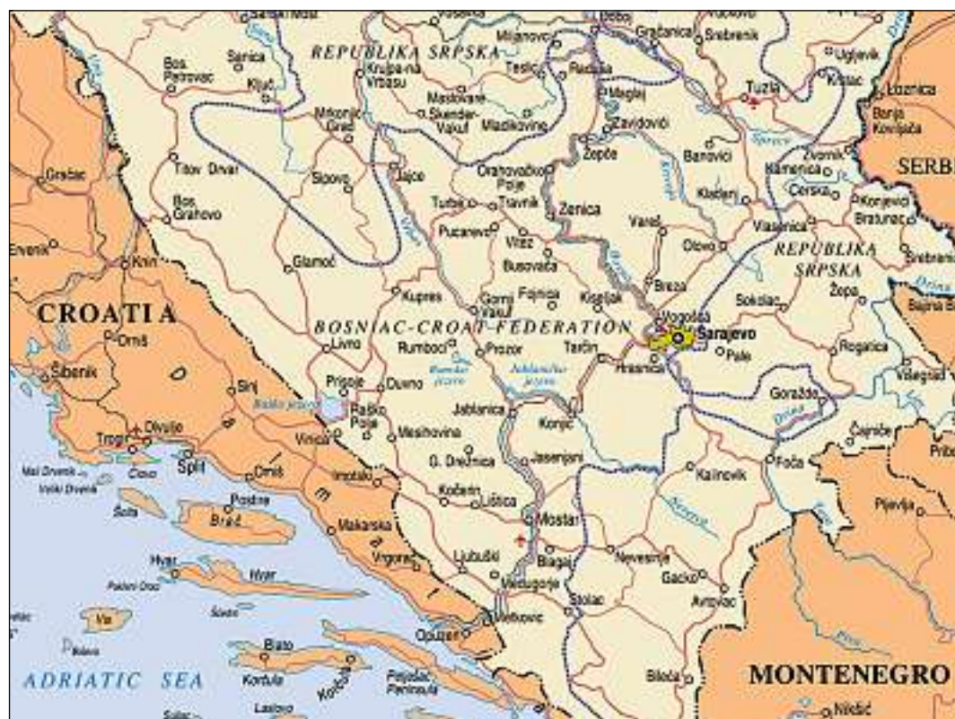
Bosnia-Erzegovina cun la ruta da la fugia: Sarajevo – Konjic – Mostar (vers sidvest)