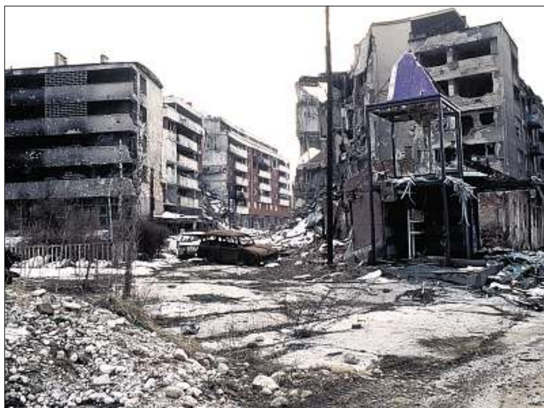
Il quartier Grbavica a Sarajevo suenter la fin da la guerra (1992-1995)

chatta.ch/index.php?hiid=532 www.chattà.ch