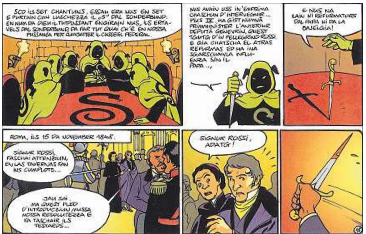
1848: Ils ertavels dal Sonderbund vegnan activs.

L'onn 1970 cuntanscha il moviment cunter la «surpopolaziun estra» e la «surimmigraziun» ses punct culmi-