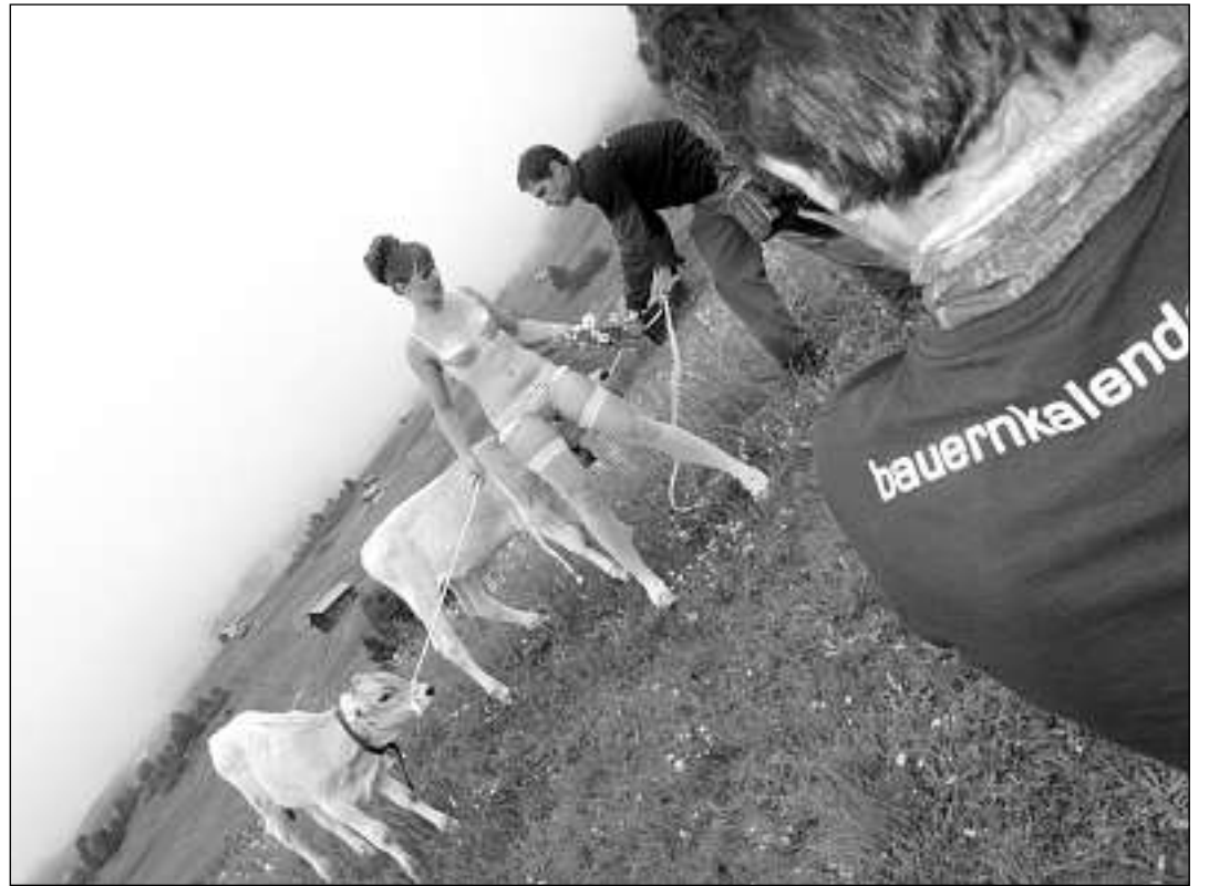
Ils vadels han almain anc plegna che protegja da la fradaglia. Vroni dal chantun Sviz ha mo ils dessous che na stgaudan lidi nagut.