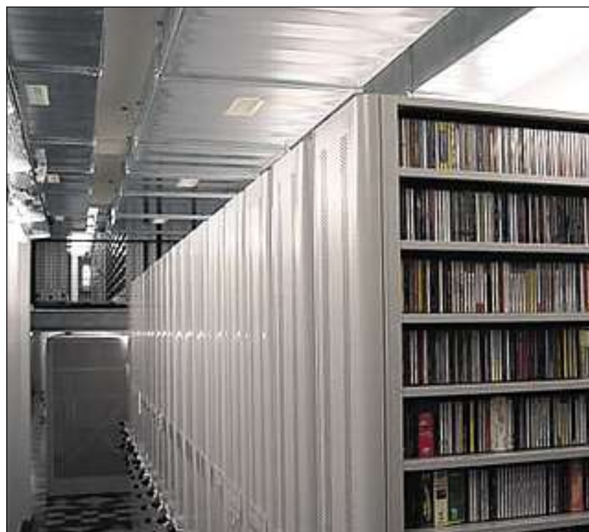
In sguard en l'archiv da la Fonoteca Naziunala.

La Fonoteca Naziunala Svizra preschenta sias colleziuns al public en differents furmas. Il catalog permetta la retschertga da scadin portatun, toc musical u registraziun; la tschertga vegn effectuada en l'entira banca da datas. Cun la tschertga tematica pon ins chattar segund giavisch per exempel tut ils portatuns che cuntegnan in num specific, in titel musical precis u in tschert label. Cun la tschertga tenor projects pon ins chattar ils portatuns liads ad in project definì. Autras funtaunas d'infurmaziun en ils inventaris e las discografias. Ultra l'infurmaziun e l'access a las colleziuns offerescha la Fonoteca divers servetschs da consultaziun e prestaziuns tecnicas en ils suandants secturs: organizaziun, con-