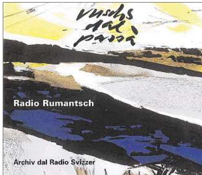
Vusch dal passà: las pli veglias emissivns da radio rumantschas 1936-1966.