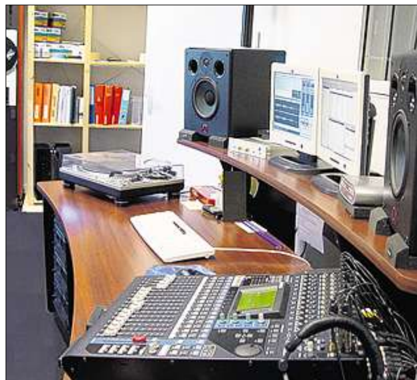
Il departament tecnic ed informatic exequescha las lavurs da copia e restauraziun.

Ils exemplars dals products da l'industria discografica che en depositads