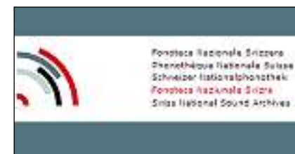
Il logo da la Fonoteca Naziunala Svizra.MAD

ina retschertga precisa e svelta. Ils documents vegnan mess en in context che permetta d'eruir lur origin e lur istorgia. La documentaziun daventa particular-