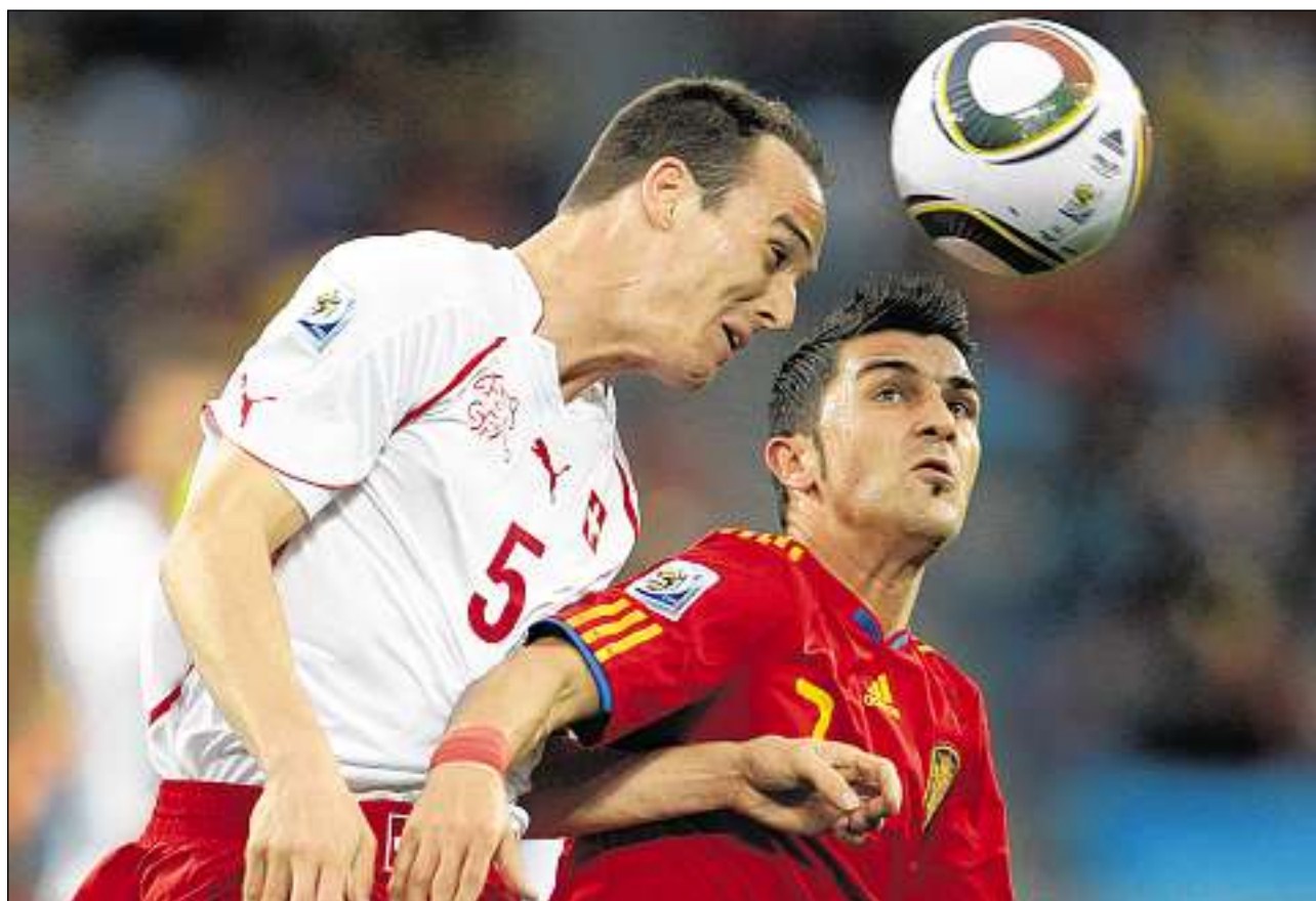
Cur ch'ils aspectaturs retegnan il flad.

Ina da las reglas che dat adina puspè da discutir tranter ils giugaders ed aspecta-