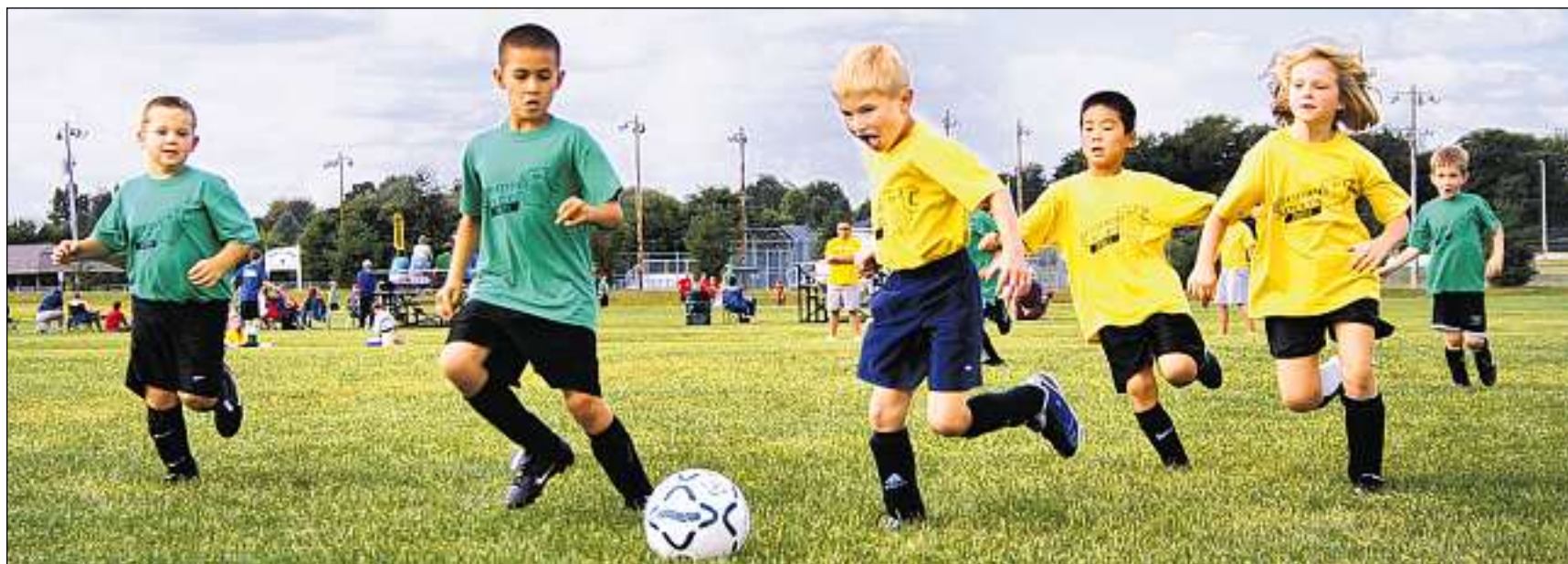
Ballape – in sport per pitschen e grond.