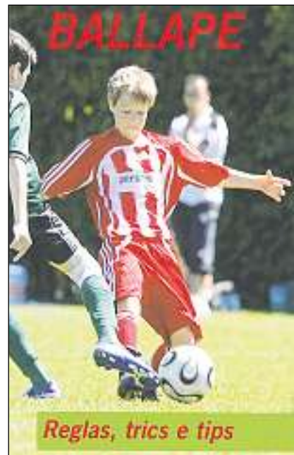
Cuverta dal carnet OSL.

Ma atenziun: dar endretg ballape n'è tuttavia betg uschè simpel. Il ballape è in sport tecnicamain pretensius, nua ch'igl è d'avantag d'enconuscher bain las reglas, la tecnica ed ils trics.