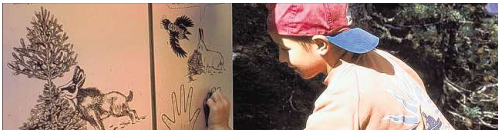
Legend las tavlas da la senda ecologica vegnan ins a savair danunder ch'ils pigns pitschens han lur furma caracteristica.

La senda duess intimar da far ulteriuras observaziuns, cumparegliaziuns e dis-