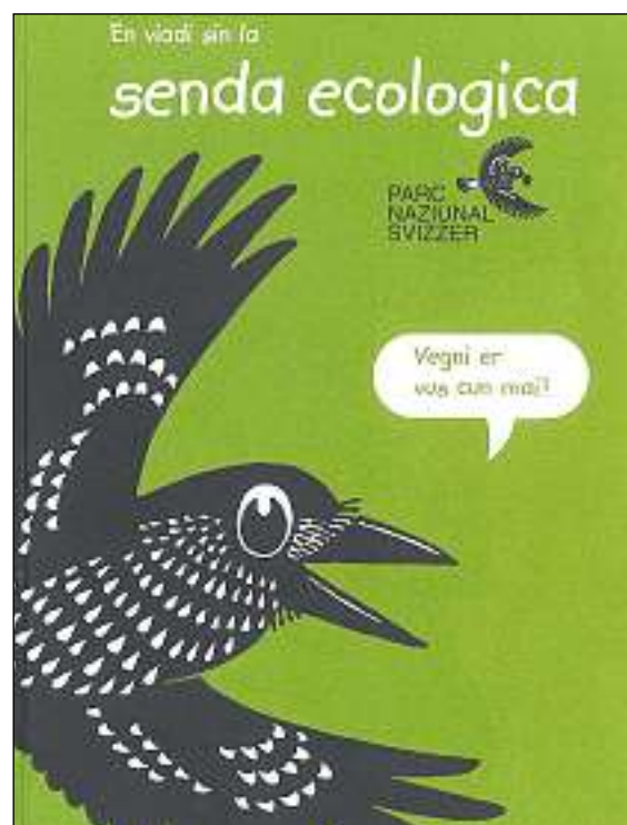
Cuverta dal cudeschet «En viadi sin la senda ecologica» (2000).

Uals alpins nets sco l'Ova dal Fuorn èn abitadis ideals per la litgiva d'ual . Ella fa l'atun chavas en la glera luca e met-