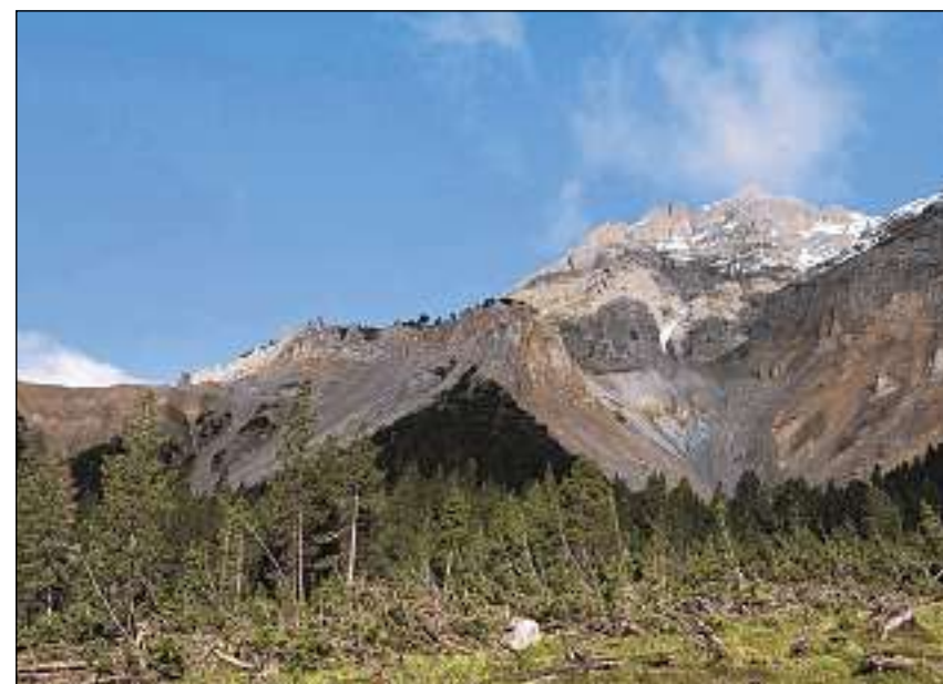
La primavera è turnada en il Parc Naziunal Svizzer.

cussius: En tge nischa da grip vegnan mess ora ils tschess barbets giuven? Pertge giaschan qua tantas plantas per terra? Co sai jau differenziar il sember dal tieu alpin? Sin las tavlas vegnan ils viandants e las viandantas accumpagnads da la cratschla, il simbol dal PNS. Ella procura che las respostas a las dumondas menziunadas na sa restrenschan betg mo a l'intermediaziun da savida. Cun sias alas mussa ella co ch'ins po imitar bleras chaussas da la natira, uschè ch'ellas d'avanter pli palpablas.